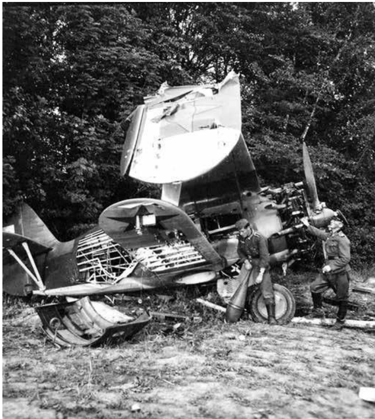
Разбитый истребитель И-153 «Чайка» осматривают немецкие солдаты. 1941 год