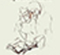
Кіра Шпиди Життя експрессионістський