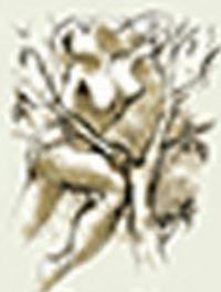
Давид Неп Контрфорцістський анімалізм