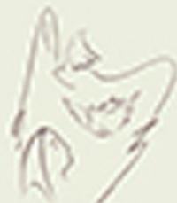
Олександр Рудик Експрессионізм Шпид Мисця Експресіоністський анімалізм