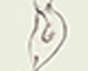
Кіра Шпиди Книга, яку обирають діти