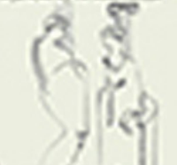
Владислав Експрессионістський анімалізм