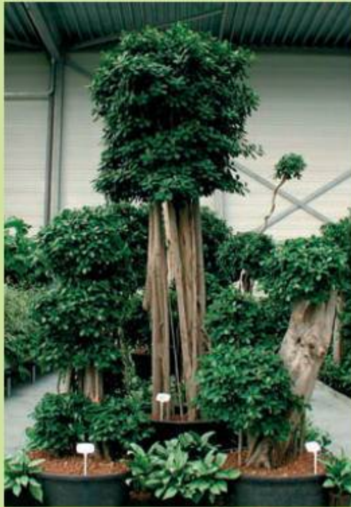
Композиция из штамбовых и кустистых форм

Комнатные «деревья и кустарники», как и все крупномеры, – очень красивые и эффектные растения, но взрослые экземпляры стоят крайне дорого, и все же, если вам очень хочется, имеет смысл вложить в них деньги. Вы можете также купить молодое растение, оно адаптируется к новым условиям даже лучше и легче переносит тяготы транспортировки.