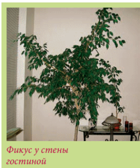
Фигус у стены гостиной

Гостиная – нередко самая «зеленая» комната в городской квартире. Здесь размещают наиболее красивые и дорогие растения. И это не случайно. Во-первых, комнатные растения создают особую атмосферу уюта, необходимого помещению, предназначенному для приема гостей. Во-вторых, как правило, гостиная – одна из наиболее светлых комнат в квартире. Поэтому в ней уютно не только людям, но и растениям. Для гостиной более всего подойдут несколько зеленых островков, образованных группой комнатных растений, а также эффектно будет смотреться отдельно стоящий солитер в красивом кашпо.