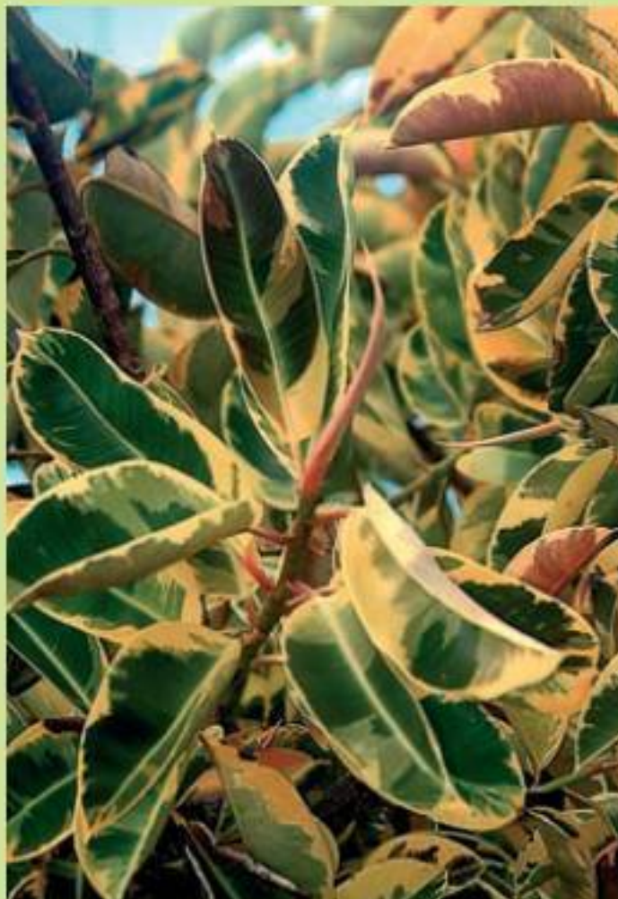
Фигус эластика, пестролистная форма

Некоторые из растений этой группы, такие как большинство фикусов, кипарис комнатный и лавр, образуют мелкие цветы, но все же в основном эти растения выращивают ради листы и общего зрительного эффекта, который они производят своим видом. Это не значит, конечно, что декоративно-лиственные растения используют только как фон для яркоокрашенных цветущих. Такие растения из этой группы, как бересклет японский, шеффлера, дизиготека, кордилина, драцена и др., сами могут похвастаться яркоокрашенной листвой, которую они демонстрируют круглый год. Еще больше видов с пестроокрашенными листьями – полосатыми, пятнистыми, с белой или кремовой серединой и т. д. Намечается растущая тенденция к выращиванию пестролистных форм традиционных растений – таких как фикус Бенджамина, фатсия японская, монстера деликатесная, мирт, которые начинают вытеснять своих зеленых родителей.