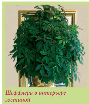
Шеффлера в интерьере гостиной