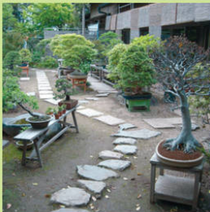
Бонсай в японском саду

Японский сад с собственным неповторимым стилем всегда безусловно узнаваем. Извилистые дорожки, композиции из камней на мелком гравии, покрытые мхом валуны, каменные фонари, живописные берега водоемов. Клены, сосны, бамбуки и злаки, фигурно постриженные зеленые насаждения, преобладание вечнозеленых – это и есть типичная картинка японского сада. Но японский сад может состоять и из тринадцати камней, один из которых всегда скрыт от взгляда. Японский сад может состоять просто из одного дерева. Японский сад может иметь несколько шагов в длину и ширину, и, делая эти шаги, вы будете перешагивать через растущие в нем деревья. Они широко известны в мире под названием бонсай, и их выращивание – это сложный кропотливый труд. Бонсай – это самое настоящее дерево, которое в естественных условиях могло бы вырасти до многометровой высоты, но подрезанные особым образом корни и крона превратили его в миниатюру – маленькое растение с причудливо изогнутыми ветвями и изящными крохотными листьями.