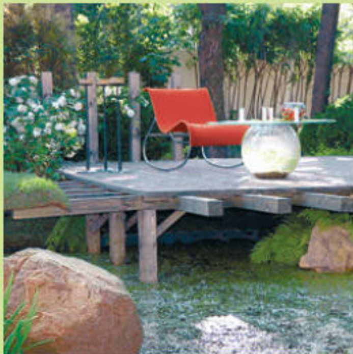
Уголок для отдыха в ориентальном стиле

Существует расхожее представление, что, используя набор определенных штампов, например, поместив рядом с дорожкой из каменных плит и гальки каменный фонарик и посадив японский клен, мы получим японский сад. Это не совсем так. Безусловно, все, что подразумевается под японским или китайским садом в наших краях, это в той или иной мере лишь стилизация под него. Нереально за пару-тройку лет сотворить в окрестностях Бердичева парк Рёандзи, княжеский сад Гу Ван Фу или Тао Жан Тин. Настоящий японский (или китайский) сад – это сад, который находится в Японии (или Китае), а то, что можем создать мы – это будет сад в японском или китайском стиле. Но ведь главное, чтобы было красиво и комфортно – «океан можно увидеть и в чашке воды».