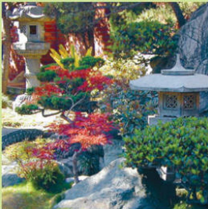
Современный сад в японском стиле

Тематические сады: японские, китайские, английские, французские – известны во всем мире. Благодаря уникальному сочетанию природы, культурного наследия, желания правителей и искусства садовников мы можем любоваться цветущей сакурой среди камней, причудливой пагодой у журчащего ручья, лабиринтом из кустарника и аккуратно подстриженными деревьями, напоминающими эпоху Людовика XIV.