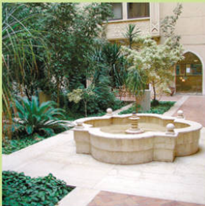
Патио в мусульманском стиле

Мусульманский сад. Если солнца на вашем участке в избытке, достаток позволяет ни в чем себе не отказывать, а душе близок созерцательный покой восточной философии, то этот стиль сада для вас. На его основе родились стили испанских и мавританских садов. Но во главу угла мусульманского сада ставится великолепие украшений (яркие цветы, мрамор фонтанов, птицы в золотых клетках), а не стремление к уединению. Мусульманский сад призван поражать воображение и ассоциироваться с раем на земле. Закладывают его, ориентируясь на строгие каноны ислама: его основа – четкий квадрат, разделенный на четыре части, так называемый «чор-багх» («четыре сада»). Такая форма сада, видимо, является отражением легенды о райском саде, из которого в четырех направлениях вытекают четыре реки, а возможно, прообразом такой планировки стала древнейшая святыня, расположенная в Мекке. Как бы то ни было, строгая геометричность квадратов планировки подчеркивается с помощью дорожек, растений и каналов с водой. Главное украшение всего сада – расположенные в центрах квадратов небольшие фонтаны или бассейны, облицованные мрамором, разноцветными керамическими плитками и стеклом.