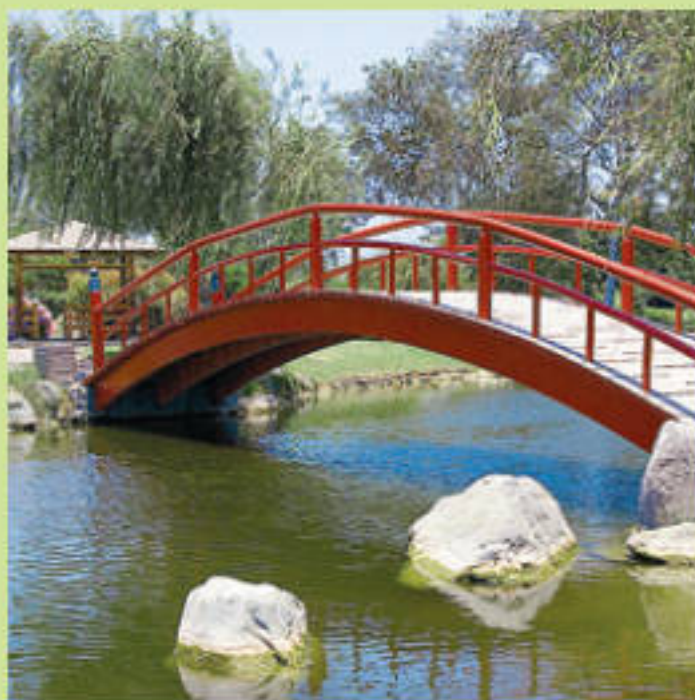
Красный мостик — характерная деталь японского сада

Японские сады во многом унаследовали китайские традиции, еще более одухотворив искусственно создаваемый ландшафт. Классика японского сада – чайный павильон, хризантемы, бонсай и сакура. Цветение любого дерева – событие, листопад – праздник, первый снег – повод сложить хокку, так что японский сад – вереница сменяющих друг друга торжеств. В глубине сада, ближе к дому, обычно рядом с террасой, располагается сад камней. Здесь можно замереть не столько в восхищении, сколько в раздумье. Японские сады всегда обустроены в полном соответствии с рекомендациями Фэн-шуй. И в правильном гармоничном саду энергия течет свободно, травы и цветы напоминают о непостоянстве, а камни и песок – о покое и твердости.