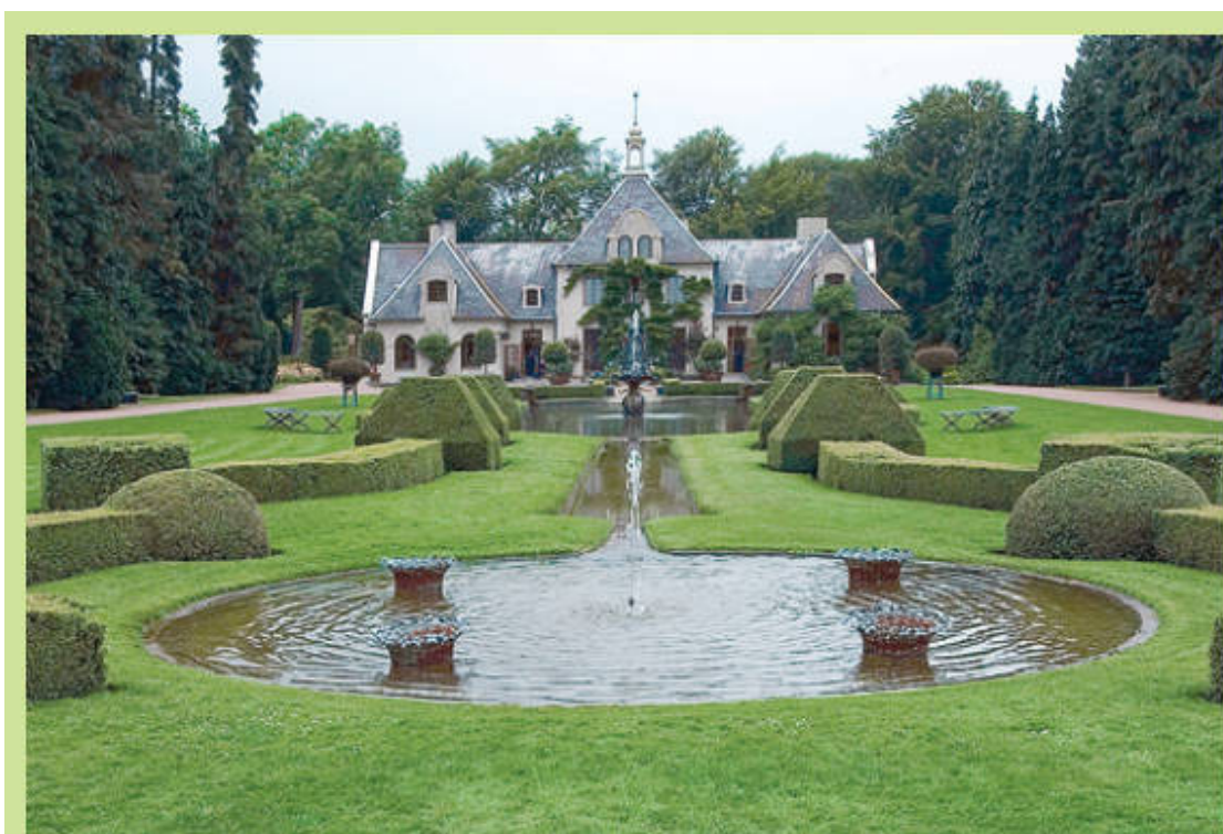
Регулярный сад требует пространства

При выборе растений отдается предпочтение видам, хорошо поддающимся стрижке и долго сохраняющим заданную форму (вечнозеленым, медленнорастущим, мелколистным). Широко используются боскеты – геометрически правильные и симметрично расположенные небольшие участки, обрамленные стриженной изгородью из самшита. Внутри боскетов регулярно или свободно высаживаются деревья, кустарники или цветы. Образ итальянского регулярного сада создается на большой площади, имеющей возвышенности. На самой высокой или центральной возводят основное здание. Сад планируется как продолжение дома под открытым небом – в том же стиле. Основное внимание уделяется парадной части перед фасадом здания, как правило, видной от входа в сад: здесь могут быть и террасы, и водный каскад с фонтанами, и парадная лестница со скульптурными группами, и центральная клумба. Отдаленные «комнаты» сада могут напоминать уединенные внутренние сады замков или крепостей.