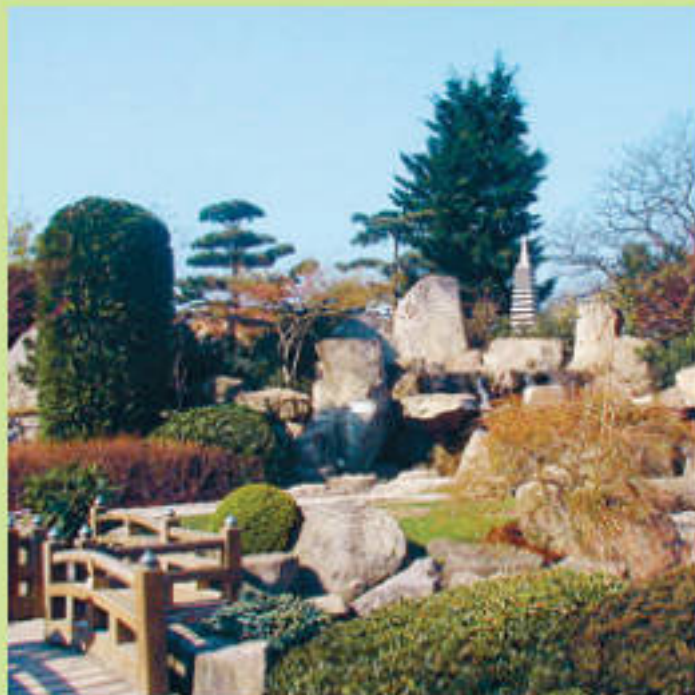
Ландшафт японского сада

Япония и Китай находятся рядом и имеют давние связи. Японская культура очень много взяла у китайской – но все же наряду с элементами сходства между этими двумя культурами существуют разительные отличия. Если главной особенностью японского стиля ландшафтного дизайна является безусловная ценность любой детали, любого элемента системы, то в Китае на первый план выходит иерархичность, подчиненность одних элементов другим. Японские и китайские сады одновременно и очень похожи и кардинально разнятся – как две стороны одной медали, как икебана и лаковая шкатулка. Если в японском саду пустота является необходимым и обязательным элементом, иногда ее даже на европейский взгляд в избытке, то в китайском саду пространство виртуозно заполняется тщательно продуманными деталями.