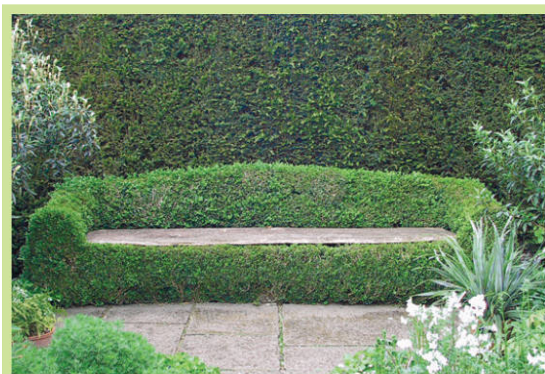
Романтический сад в английском стиле

Регулярные сады – прерогатива больших площадей; шесть соток, которыми располагают большинство дачников, увы, для этого мало подходят, но элементы этого стиля вполне возможны и тут. Регулярная планировка предполагает аллеюную посадку деревьев и кустарников, подчеркивающую симметрию сада. Тщательно продумываются видовые точки, находящиеся в пересечении аллей: к спокойному созерцанию располагают установленные там каменные, деревянные или литые павильоны, беседки, скамьи вокруг фонтанов, скульптуры и т. д.