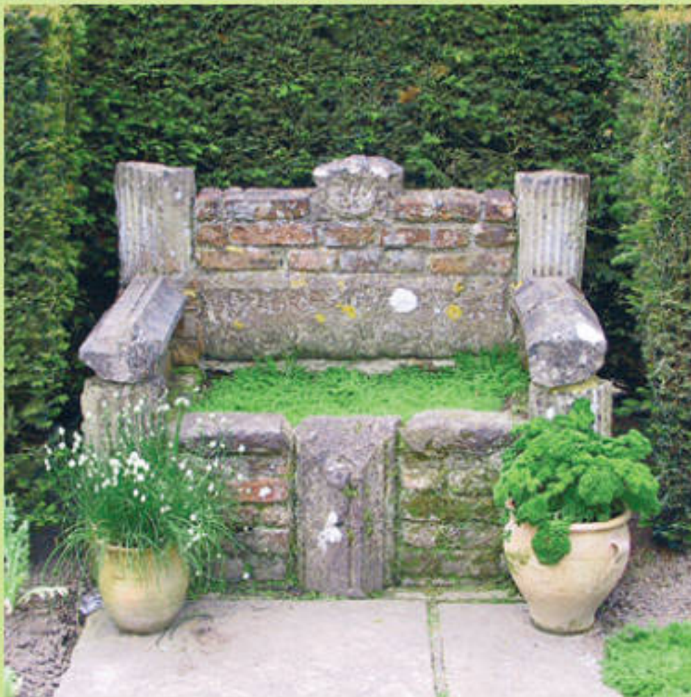
Уголок монастырского сада

Если ваш относительно небольшой внутренний дворик (патио) находится на солнечной стороне сада и вы хотели бы, чтобы он служил дополнительной комнатой на открытом воздухе, то само собой напрашивается идея превратить его в мавританский сад . Этот стиль зародился в средневековых замках Испании, находившейся под влиянием арабов, и впитал в себя черты средневековой романтики и восточную негу. Обычно обрамлением такого сада служат галереи и крытые аллеи, увитые виноградом и розами. Большое внимание уделяется воде, причем она может быть представлена в самых разных формах: спокойная зеркальная гладь, струящиеся и стекающие ленты, падающие струи, разлетающиеся брызги. Деревья высажены регулярно, но не подстригаются, цветники обрамляются мозаичным мощением. Интересно, что сад в этом стиле не обязан быть композиционно связанным с основным зданием.