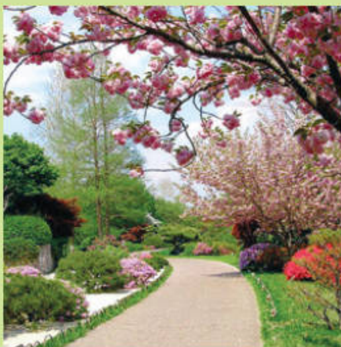
Плодовый сад в японском стиле весной

Что такое сад? Это гармония. Гармония сочетания деревьев, кустарников, цветов, травы и человеческих усилий. Сад – это своеобразная игра человека с природой. Всегда разная и неизменно чарующая. Давно миновали времена, когда наличие дачного участка было если не фактором выживания, то уж серьезным подспорьем, когда килограмм картошки или помидоров было проще вырастить, чем купить. Ушла в прошлое эпоха тотального дефицита, на дачах мы перестали выращивать овощи и фрукты в промышленных масштабах и наконец-то понятие «дача» обрело свой первозданный смысл: место освобождения души и тела от урбанистической суеты. Хотя не стоит перегибать палку, отказываясь от практических целей совершенно: на даче, безусловно, нужен и сад, и огород. Они никогда не исчезнут совершенно. Тем более что их можно эстетически трансформировать. Красиво оформленные посадки овощей и душистых трав всегда актуальны. Например, грядки, чередующиеся по цвету: зеленый лук, бордовая свекла, нежный салат и – огромные желтые тыквы – вполне в заявленном стиле. А ведь можно выращивать и столь любимый китайцами и японцами дайкон и прочие редьки с редисками, и имбирь, и сельдерей, и другие полезные и вкусные вещи. Но и плодовые деревья и кустарники очень декоративны и в цвету, и усыпанные плодами, особенно если им придать красивую форму с помощью обрезки.