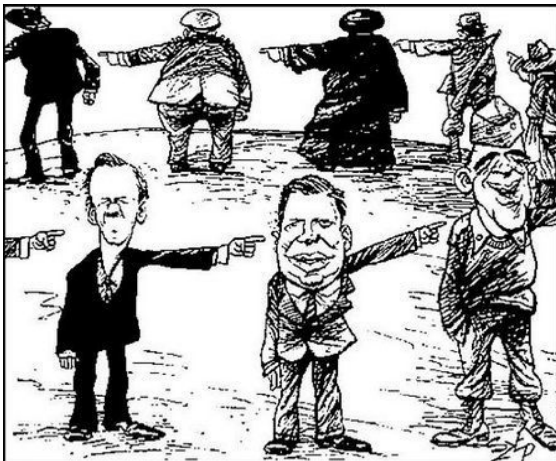
«Ирангейт». Карикатура 1987 г.

Американцы любят и ценят сенсации, их приучили к этому средства массовой информации, прежде всего телевидение, демонстрирующее судебные процессы на всю страну. Все эти бесконечные процессы по делам незаконных поставок оружия, сексуальных «шалостей» высокопоставленных политиков, приправленные «шпионскими страстями», и прочая грязь вызывают особый интерес публики. Ведь, если на то пошло, в подобных историях меняются только имена, но не суть. Однако, пожалуй, один из таких скандалов, названный «ирангейтом», оказался более серьезным, чем другие.