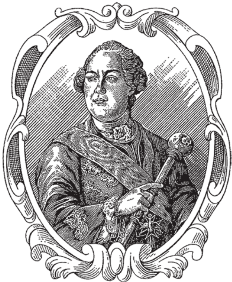
Гетьман Кирило Григорович Розумовський.