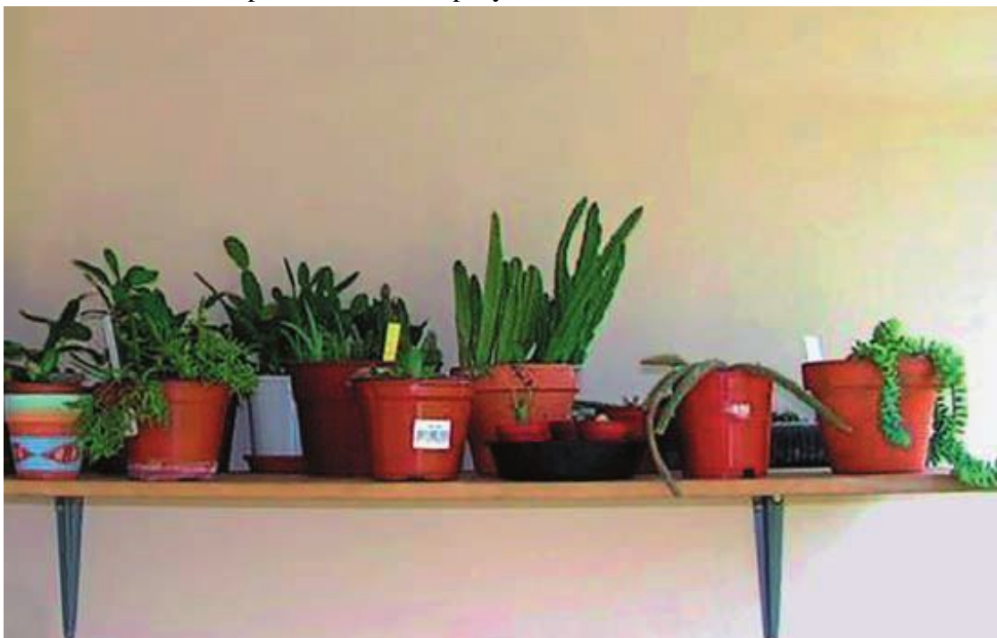
Полка на стене с нижним креплением

В окнах, ориентированных на запад, можно культивировать лишь очень ограниченное число видов, собственно, только эпифитные, какими являются зигокактусы, рипсалисы и эпифиллюмы, или же некоторые эхинопсисы, ребуции и т. п.