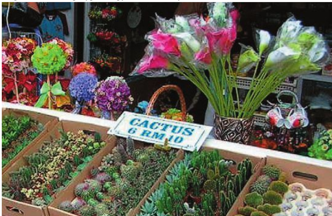
Кактусы в лотках, подготовленные к упаковке и транспортировке

Покупая кактус в цветочном магазине в холодное время года, не поспешите на такси: виды, особенно редкие, очень чувствительны к перепадам температур. Растение может погибнуть от разницы температур, которую вы и не ощутите.