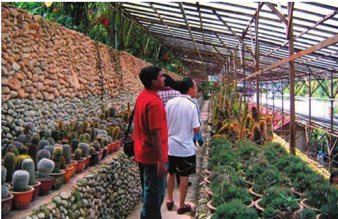
Кактусы в теплице

В определенном смысле с теплицей ничто не сравнится. Благодаря ей в наших климатических условиях можно создать не столько даже климат, сколько атмосферу настоящей экзотической природы. Исключительная красота и очарование кактусов, заметные в небольшой коллекции на окне, в тепличке, в оранжерее, заполненной этими растениями, позитивно воздействуют на ваши чувства и настроения. Войдя внутрь, вы не только отмечаете красоту отдельных экземпляров, но на вас в первую очередь воздействует коллекция как захватывающее целое.