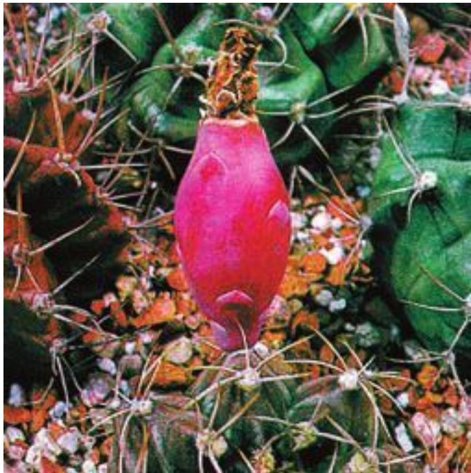
Gymnocalycium mihanovichii . Плод

Плоды кактусов, будь они размером с крупную сливу или с крошечную смородину, всегда бывают типичными ягодами: их мелкие семена вкраплены в мякоть, заключенную в кожицу. Размеры этих ягод, окраска, сочность, вкус, поверхность (гладкая или покрытая волосками и колючками) совершенно разные у кактусов различных групп. Да и все прочее в кактусах – корни, стебель, колючки, цветки и семена – отлича-