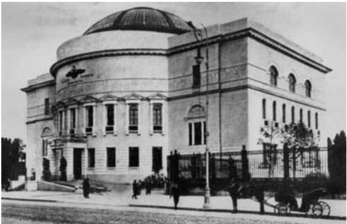
Педагогічний музей у Києві – резиденція Української Центральної Ради в 1917 році.

Німецькі війська на Західному фронті розпочали плановий відступ на відстань 135 км з лінії Нуарас – Суассон на т. зв. «лінію Зігфріда».