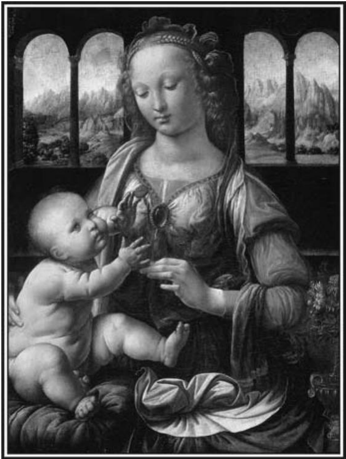
Мадонна с гвоздиком, 1472–1478

Но я не желаю от них ничего другого, кроме того, чтобы хороший живописец изобразил неистовство битвы, и чтобы поэт описал другую битву, и чтобы обе они были выставлены рядом друг с другом. Ты увидишь, где больше задержатся зрители, где они больше будут рассуждать, где раздастся больше похвал и какая удовлетворит больше. Конечно, картина, как много более полезная и прекрасная, понравится больше. Помести надпись с Божьим именем в какое-либо место и помести изображение его напротив – и ты увидишь, что будет больше