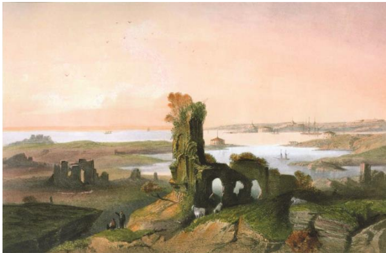
Остатки античного Херсонеса близ Севастополя. Худ. К. Боссоли. 1856 г.

Нимфей (в 17 километрах от Керчи у села Героевка, на берегу Керченского пролива), Киммерик (на южном берегу Керченского полуострова, на западном склоне горы Онук), Тиритака (к югу от Керчи у поселка Аршинцево, на берегу Керчского залива), Мирмекий и Китей к югу от Керчи, Парфений и Парфий к северу от Керчи. В Западном Крыму была основана Керкинитида (на месте современной Евпатории), на Таманском полуострове – Гермонасса (на месте Тамани) и Фанагория.