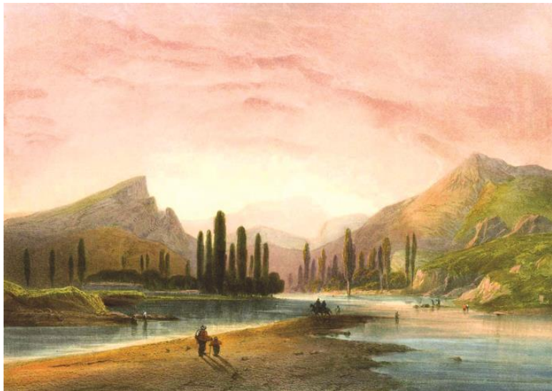
Река Альма. Худ. К. Боссоли. 1856 г.

Получается, осев в Причерноморье, киммерийцы сделали его своей базой, с которой совершали походы в глубь европейских земель, по Висле или Одру доходили до Балтийского моря. Киммерийские племена делали набеги на южное черноморское побережье, на Каппадокию, Пафлагонию и Фригию, письменные источники сообщают о том, что киммерийские войска в 20-х годах VIII века до н. э. разгромили войско закавказского царства Урарту. Впоследствии их вооруженные отряды переправились через Геллеспонт и вторглись в Малую Азию. Есть сведения, что они грабили Еги-