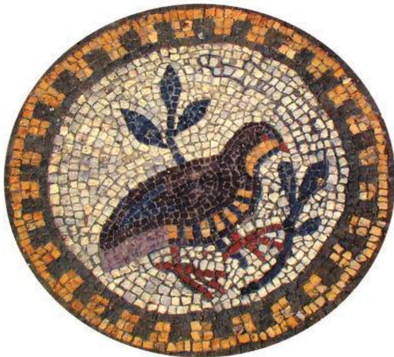
Птица. Мозаика пола православной базилики VI в. Херсонес

В первой половине V века до н. э. Пантикапей объединил вокруг себя расположенные на обоих берегах Боспора Киммерийского – Керченского пролива – греческие города-колонии. Так образовалось Боспорское царство. В VI–IV веках до н. э. Боспорское царство, как и Херсонес, не имело постоян-