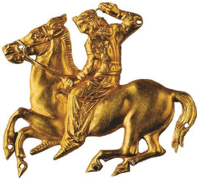
Конный скиф. Нашивная бляшка. Золото. Кургan Куль-Оба.