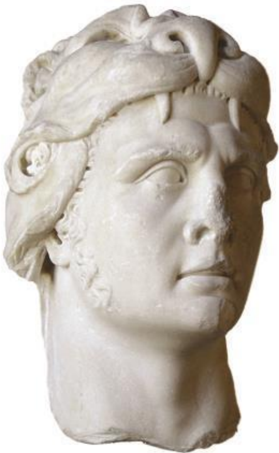
Мраморный бюст Митридата VI в образе Геракла