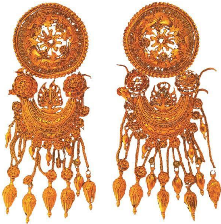
Пара золотых серег с диском и ладьевидной подвеской. Около 350 г. до н. э. Курган Куль-Оба