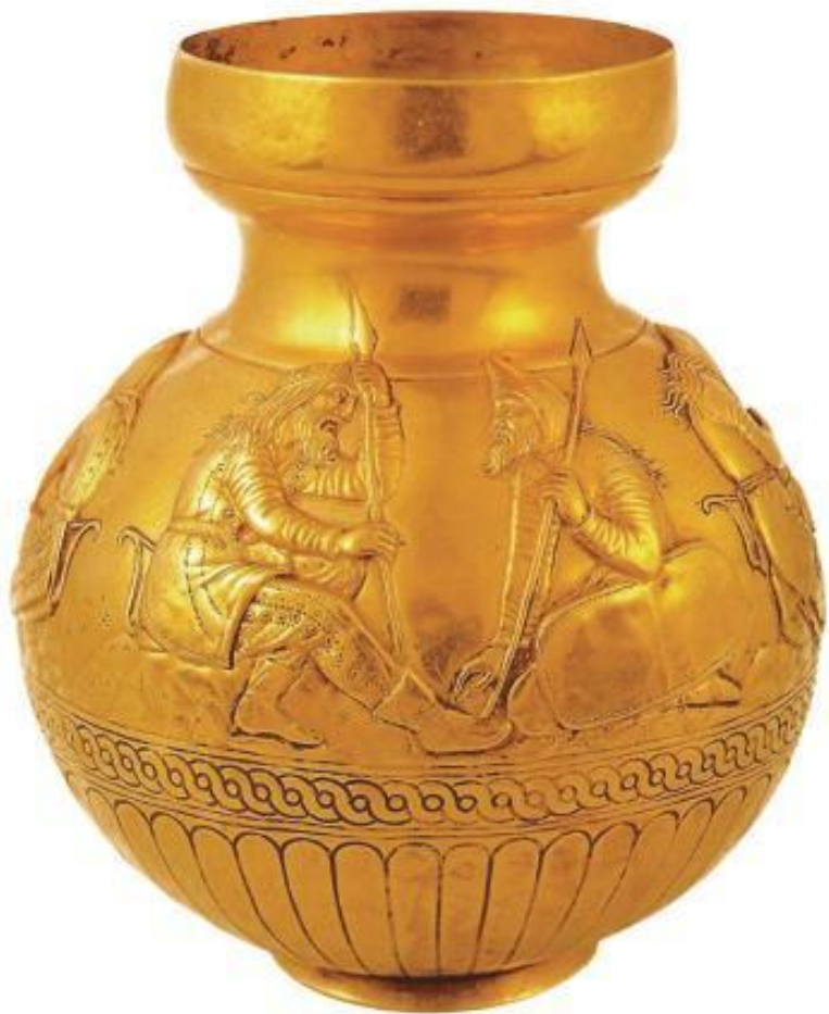
Золотая ваза из кургана Куль-Оба (IV в. до н. э.). На ней – сцены из жизни скифов