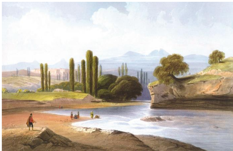
Река Салгир. Худ. К. Боссоли. 1856 г.

ной этого – военные неудачи скифов или изменение климата. Скорее всего и то и другое. Ведь к тому времени в причерноморских степях сформировалась новая сила – сарматы, племена, чей уклад был близок традиционному скифскому кибиточному кочевью. Централизованной власти у сарматских племен не было, каждое вступало в военные союзы по своему выбору. Сарматское войско состояло из племенного ополчения, постоянной армии не было. Главную часть войска составляла тяжелая кавалерия, имевшая на вооружении длинные копья и железные мечи, защищенная доспехами и в тот период практически непобедимая.