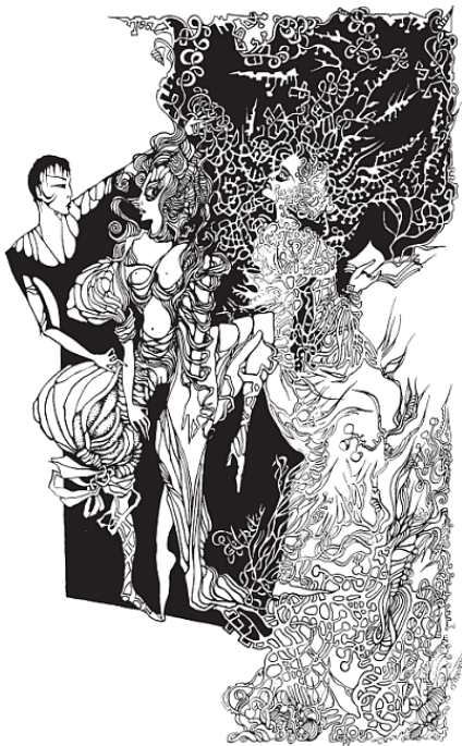
Орфей, Эвридика и Смерть