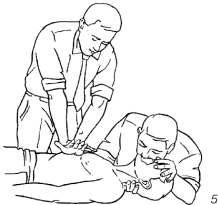
Рис. 1. Искусственное дыхание: 1 – освобождение рта от посторонних предметов; 2 – опрокидывание головы; 3 – искусственное дыхание изо рта в рот и непрямой массаж сердца (4, 5)