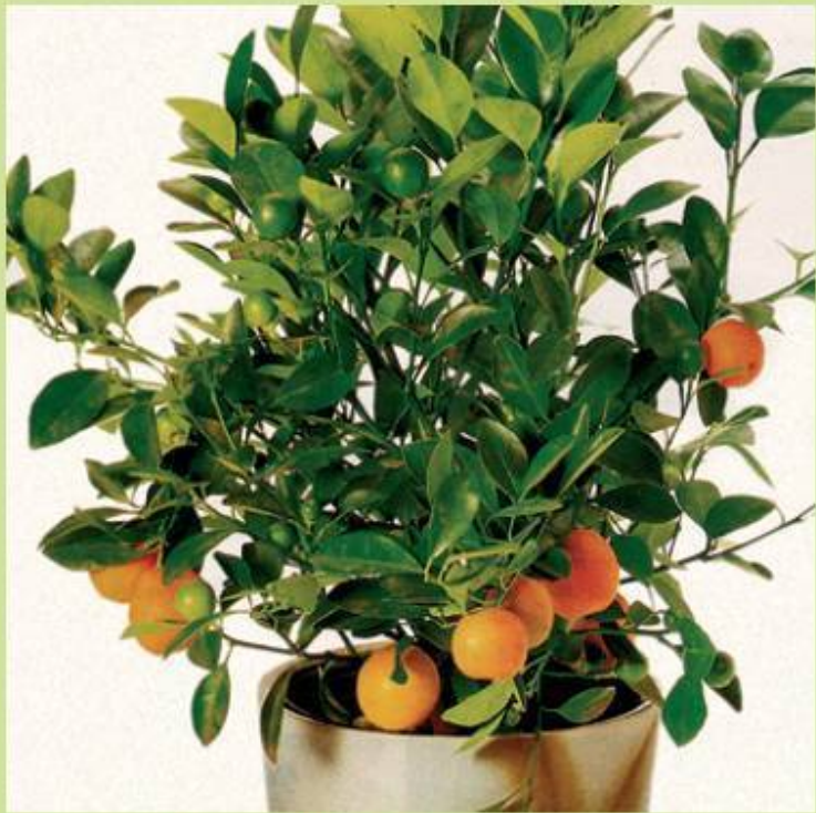
Дерево с золотыми плодами

Выращивание плодовых культур в кадках и горшках известно достаточно давно. При дворах многих правителей существовали сады, в которых росли не только цветущие, но обязательно и плодоносящие растения. Выращивание, а в особенности повышение их урожайности считалось верши-