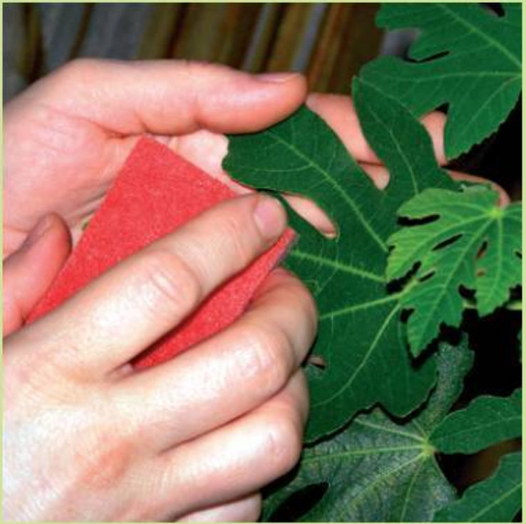
Протирание листьев влажной губкой

При систематическом обмывании листьев тепловатой водой удаляется пыль, которая приносит большой вред (задерживает проникновение к листьям солнечного света, закупоривает устьица). Обмывают растения под душем в ванной