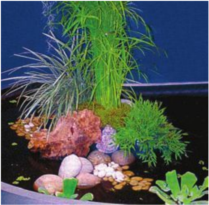
Водоем с сальвинией плавающей (в интерьере)

Наш совет: обязательно обращайтесь внимание на того, у кого вы покупаете растение. Если это хорошо знакомая фирма, или питомник, или коллекционер с известными координатами, то делать приобретение можно без опаски. В том случае, если на ваши вопросы вы не получаете грамотных ответов, то у такого продавца лучше ничего не покупать. Будьте внимательны и разборчивы при общении с продавцами