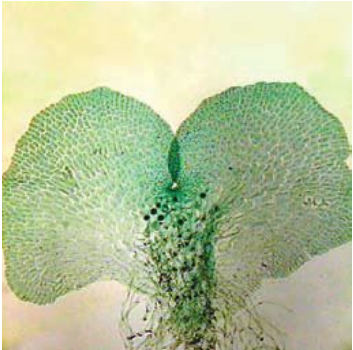
Заросток папоротника под микроскопом

недолговечному растению – заростку (гаметофиту), на котором образуются репродуктивные органы. При дальнейшем развитии растения появляется новый спорофит, крошечный зародыш которого, вырастающий из миниатюрного заростка, можно обнаружить по тенистым берегам рек.