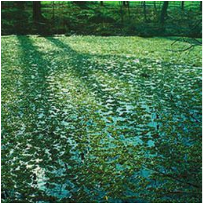
Пруд, покрытый азоллой

Следует помнить, что большинство папоротников умеренной зоны предпочитают сырые, прохладные, тенистые леса с обильной листовой подстилкой или обращенные к северу склоны глубоких оврагов с просачивающимися подземными водами. Некоторые виды (кальцефилы) приурочены к известняковым субстратам, другие (ацидофилы) лучше всего растут на кислой почве.