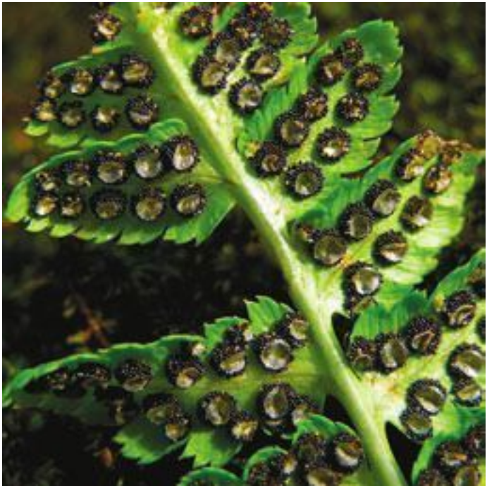
Сорусы щитовника мужского

У многих папоротников сорусы развиваются на нижней стороне вай, но бывают и исключения. Так, у великолепной осмунды королевской ( Osmunda regalis ) спороносной является верхняя часть вайи, представляющая собой метелку, густо покрытую с двух сторон темно-коричневыми спорангиями, похожими на коричневые цветки.