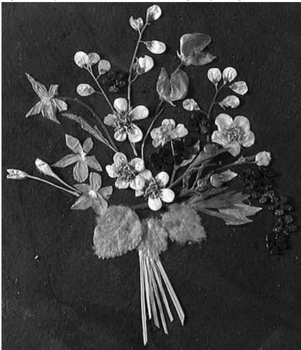
Рис. 1. Композиция из засушенных растений

Когда за окном уныло чернеют ветви деревьев и снежные вихри норовят проникнуть в каждую щелочку – особенно дороги воспоминания о солнечном лете. Ах, если бы удалось сохранить хотя бы маленькую частичку ушедших дней, как было бы здорово! Вернуть лето совсем несложно: стоит только заранее запастись засушенными растениями. А когда завоет февральская вьюга, самое время собраться всей семьей за большим столом, разложить на нем папки и коробки с засушенными цветами и начать собирать букеты (рис. 1).