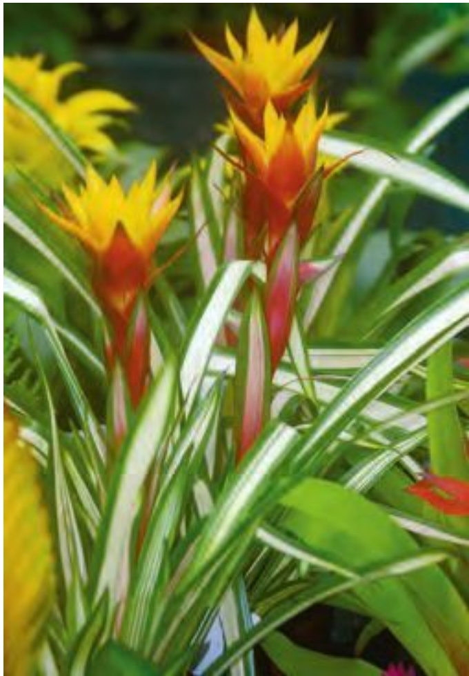
Яркие прицветники. Цветущая гусмания