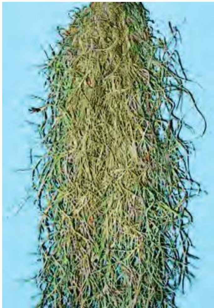
Тилландсия уснеевидная (испанский мох)