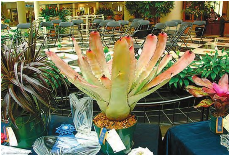
Эпифитные бромелии на выставке

Родина бромелиевых – тропики, и именно оттуда они приносят нам частицу вечного лета. А когда за окном мрачный осенний или зимний пейзаж, особенно приятно, если дома вас встречают сочная зелень и яркие соцветия любимых комнатных растений.