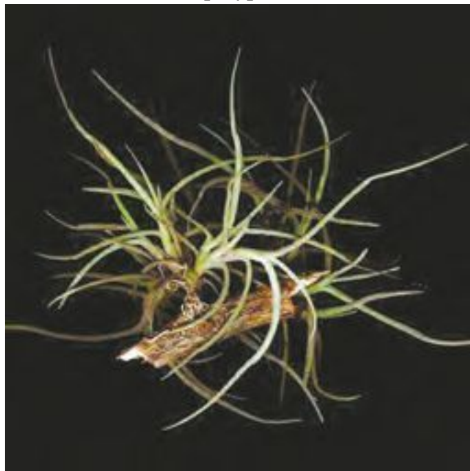
Тилландсия на ветке

лизируйте условия вашего жилища, освещенность, температуру, наличие сквозняков и прочие параметры. Для бромелий они немаловажны. Неприхотливые виды можно разместить просто на подоконнике, а есть и такие, для которых придется сооружать флорариум, потому что без соблюдения режима влажности и температуры нечего надеяться на успех.