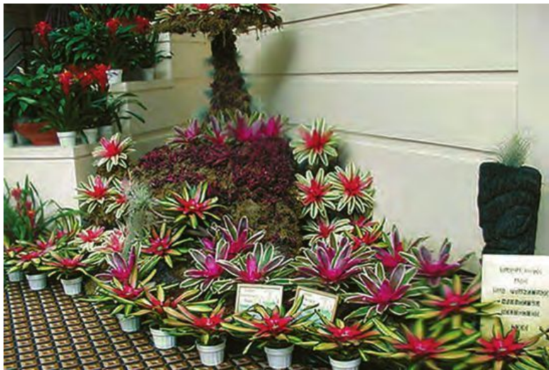
Композиция из бромелий с яркими листьями

В то же время среди их близких родственников криптантусов и тилландсий есть виды, имеющие размер, измеряемый считанными сантиметрами. Самые миниатюрные растения – из рода Тилландсия. У некоторых тилландсий розетки настолько малы (в диаметре всего несколько миллиметров), что растения могут быть приняты за мхи.