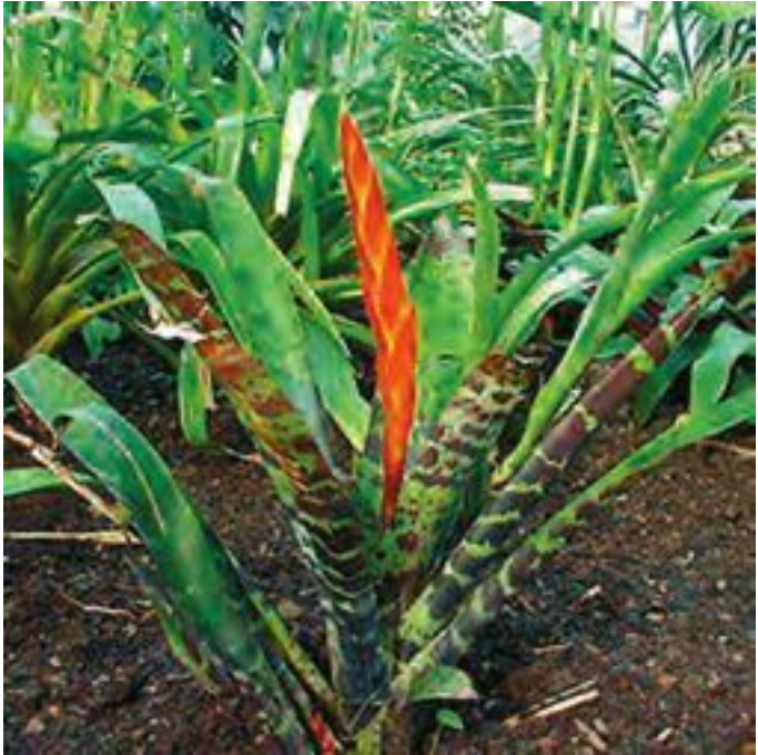
Наземные бромелии в природе

му, толстые мясистые листья, служащие хранилищами воды в период засухи, и произрастают на достаточно богатых гумусом почвах.