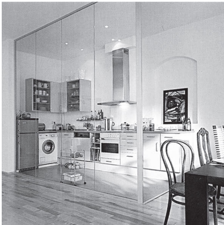
Рис. 3. Стеклопанельная стена в кухне

Стеклопанельное зонирование в ванной и кухне необязательно делать из довольно дорогих больших цельностеклянных панелей от пола до потолка. Бюджетный вариант – стеклоблоки. Некоторое время они были в опале, но сегодня, когда в моду вошел ретро-стиль, например шестидесятых-се-