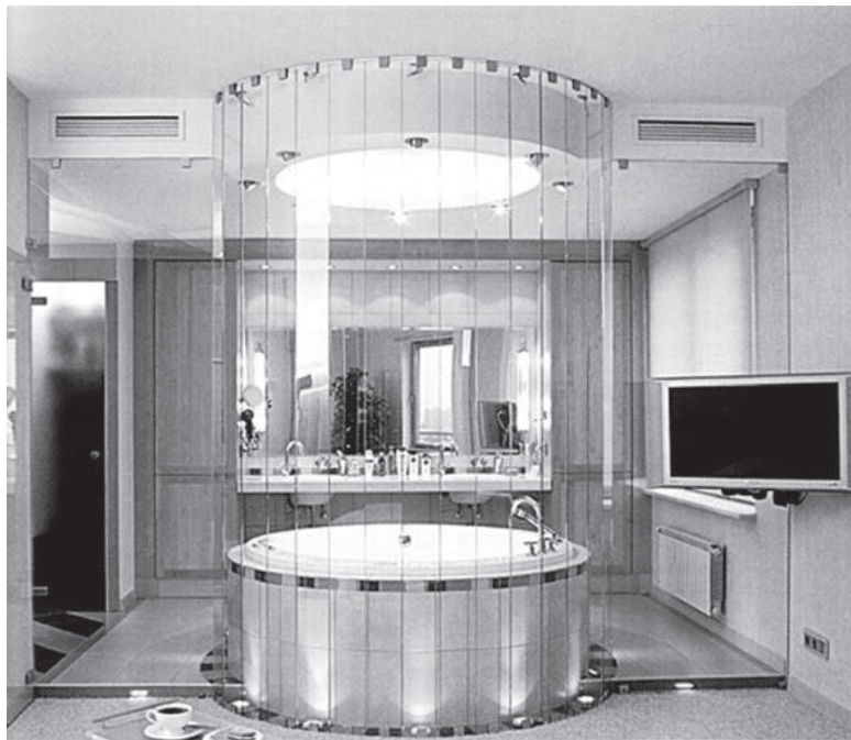
Рис. 1. Объединенное пространство ванной и спальни. Композиционным центром является круглая ванна, она отделена от кровати стеклянной перегородкой сложной формы

роизоляция, необходимо поднять стяжку, желателен теплый пол. Обязательно установите систему принудительной вентиляции (см. рис. 1, 2).