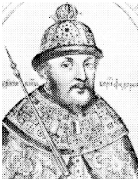
Русский царь с 1598 по 1605 год.

Борис Годунов вполне мог оставить о себе память как о блестящем правителе. От природы он имел здравый ум, но отсутствие образования сужало круг его воззрений. К этому добавилось то, что вторая половина его короткого царствования омрачилась голодом и смутами. И все же, наверное, главное несчастье Годунова заключалось в том, что москвичи его так и не восприняли как Богом данного царя, не прощали ему просчетов и редко испытывали благодарность за его щедрые жесты. Его терпели лишь как ловкого проходимца, интригой овладевшего чужим тронном.