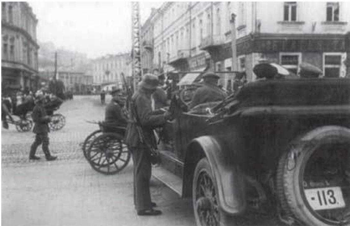
Німці на Хрещатику (перевірка документів). 1918 р.

В. Вернадський (квітень 1918 р.): «Німці все йдуть і йдуть. Вони йдуть – їх замінюють інші. І серед українців усе сильніше йде сумнів. А в народі глухе незадоволення. Німці нерідко грубі – очевидно, і в їхньому середовищі роздратування: їх запросили, а тим часом вони як би серед ворогів. У селах, через які вони проходять, вони практично грабують, подекуди гвалтують жінок» . 39