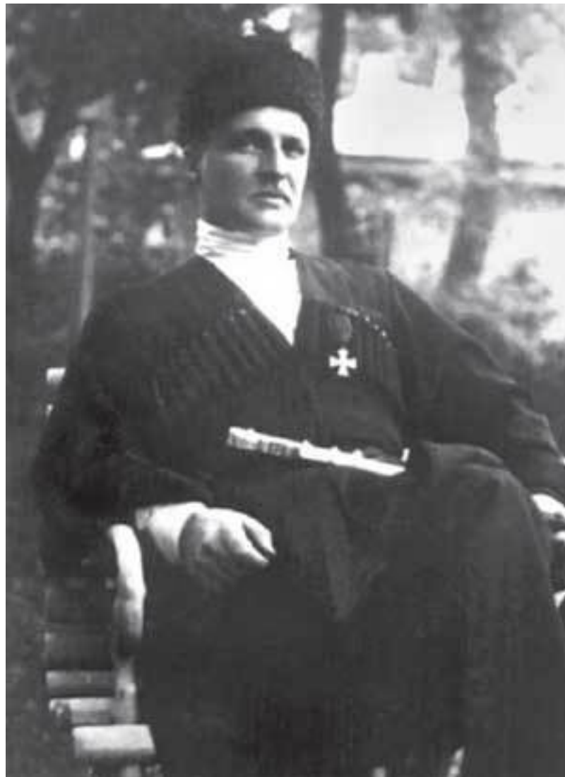
Гетьман України Павло Скоропадський.

Народився 3(15) травня 1873 р. у Вісбадені в родині Петра та Марії (з дому Міклашевських). Дитячі роки провів у родовому маєтку Тростянець на Полтавщині. Освіту розпочав зі Стародубської гімназії. 1893 р. закінчив Пажеський корпус і розпочав службу в Кавалергардському полку. З 1895 р. – полковий ад'ютант, з 1897-го – поручник цього полку. Учасник російсько-японської війни: командир сотні Читинського козачого полку, ад'ютант командувача військами на Далекому Сході. З грудня 1905 р. – полковник, флігель-ад'ютант імператора Миколи II. З вересня 1910 р. – командир 20-го драгунського Фінляндського полку. З 1912 р. – генерал-майор.