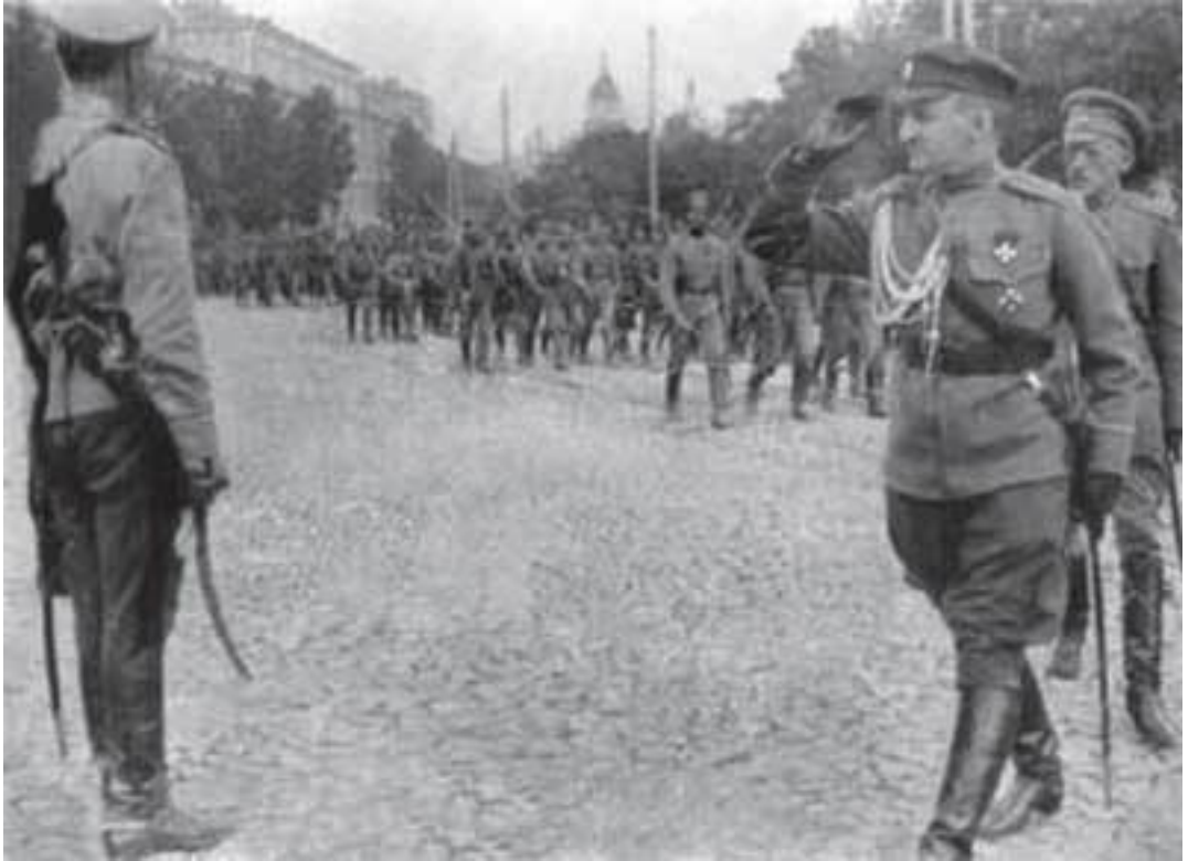
Парад українських частин у Києві.