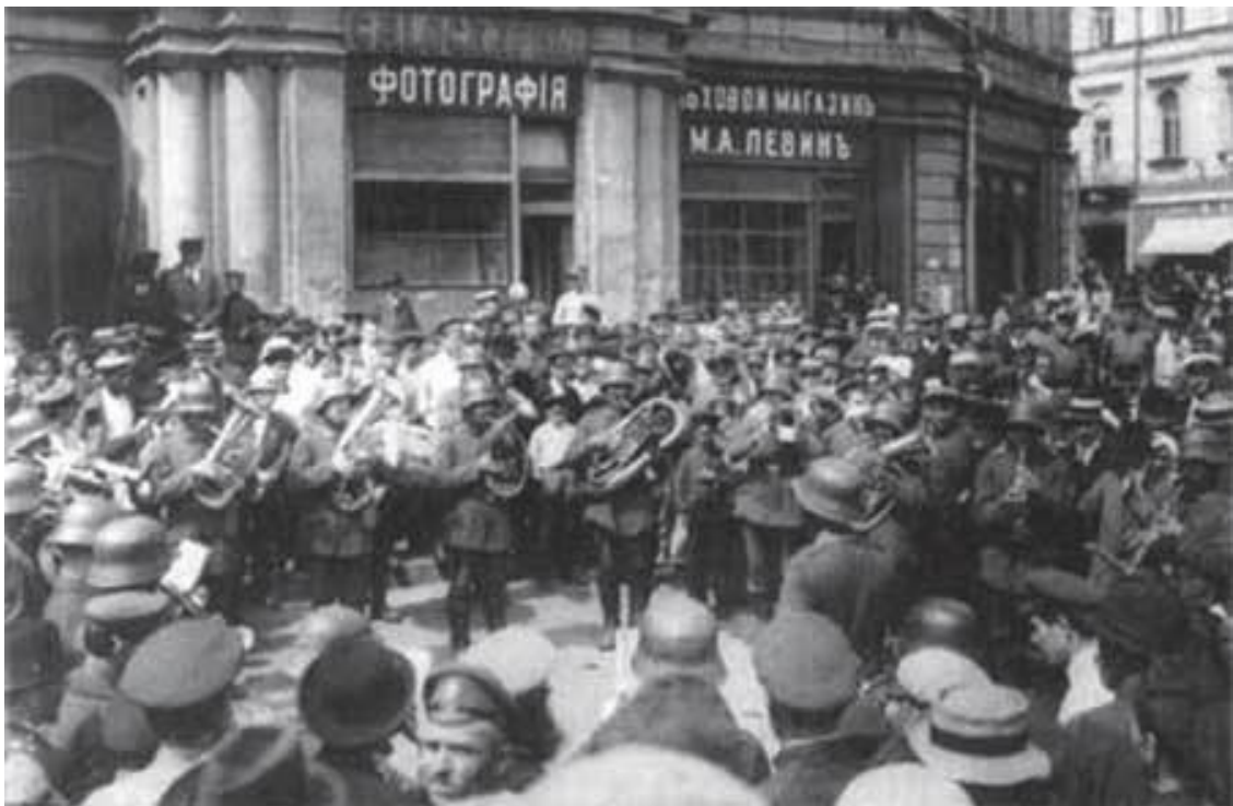
Німецький військовий оркестр біля будинку міської думи у Києві.

усіма наслідками, які з цього випливали. Друга теза така: виконуючи умови Брестської угоди, Скоропадський «рятував Україну від приєднання до Німеччини» 40 , хоча таких планів у Берліні ніколи не існувало й існувати не могло. Інший шанований у професійних колах дослідник слушно говорить про те, що окупація для Української Держави крім негативних мала і позитивні наслідки, оскільки окупаційні війська були підпорою встановленого в Україні державного ладу, певною перешкодою здійсненню планів більшовиків щодо України і в цьому розумінні виконували роль стабілізуючого чинника. «Для РСФРР, її уряду німецько-австрійська окупація України була стримуючим фактором у проведенні російської політики щодо України, що в рамках здійснення політичної програми більшовиків зумовлював необхідність пошуку нових напрямів і форм її реалізації» . 41