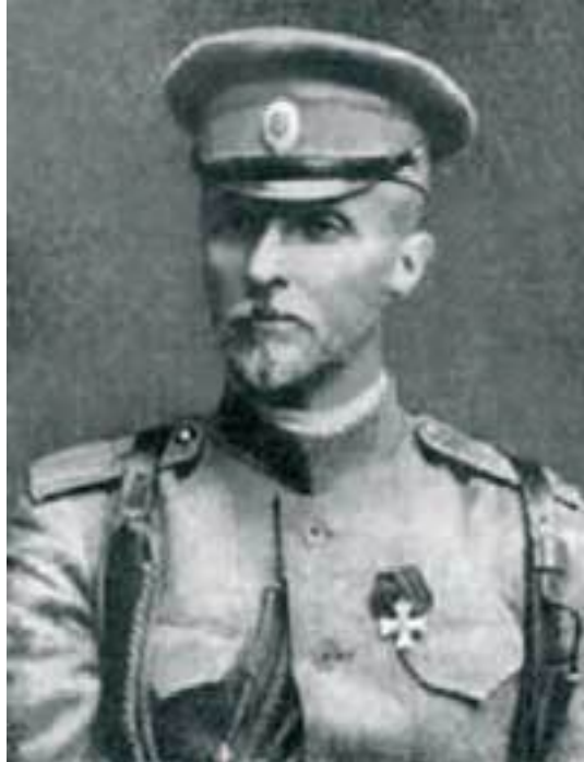
Генерал Павло Скоропадський, командир Українського корпусу, 1917 р.

Учасник Першої світової війни: командир полку, командир дивізії. З 1916 р. – генерал-лейтенант, із січня 1917 р. – командувач 34-го армійського корпусу. В серпні 1917 р. перетворив корпус на 1-й Український. У жовтні на з'їзді в Чигирині обраний отаманом Вільного козацтва. Взяв участь у війні з більшовиками, зокрема в боях проти 2-го гвардійського корпусу.