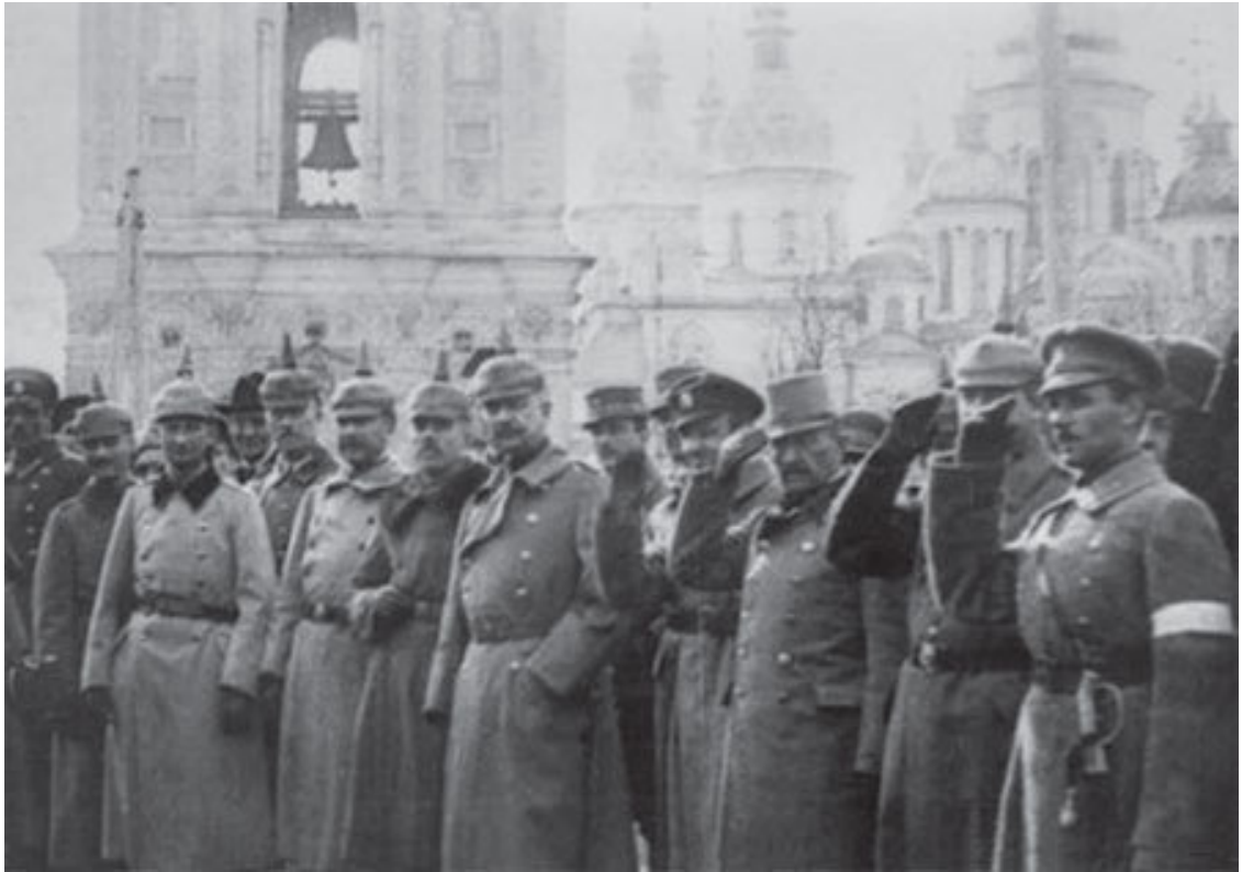
Німецькі війська у Києві. 1918р.