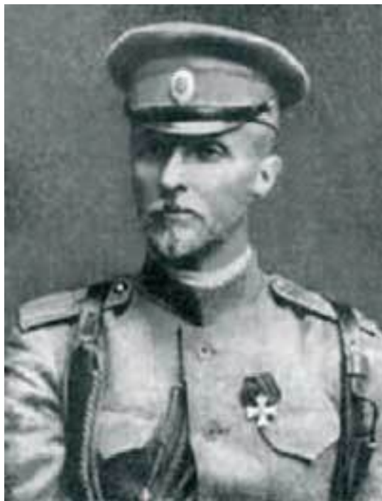
Генерал Павло Скоропадський, командир Українського корпусу, 1917 р.