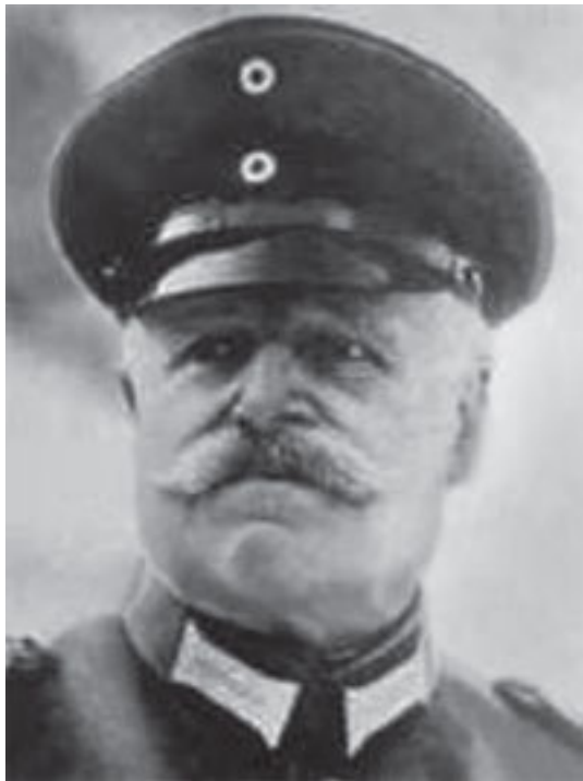
Герман фон Ейхгорн.

Перші ознаки життя нового державного утворення слід,