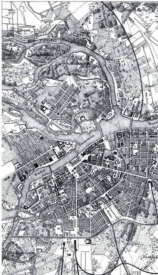
САНКТ-ПЕТЕРБУРГ 1897 год