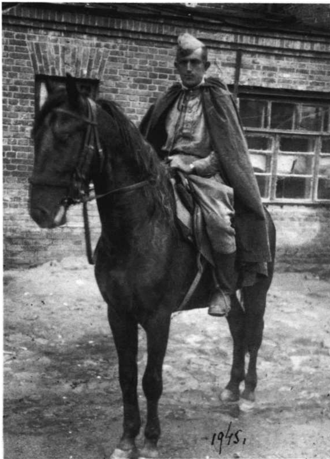
Шоул бар Мэттио 9 мая 1945 года