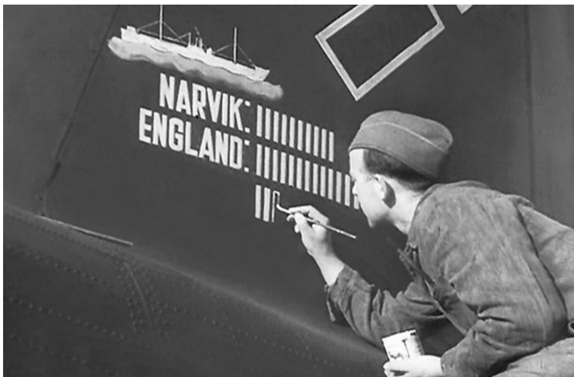
Начало 1941 года. Член экипажа тяжелого бомбардировщика FW-200 «Kondor» наносит на хвост машины очередную отметку победы