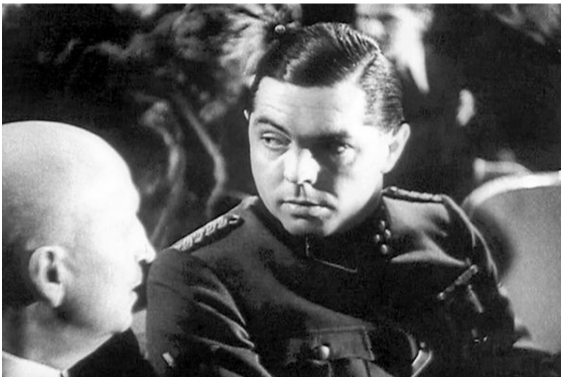
На заседании Имперской кинопалаты. Штурмбаннфюрер СС Фриц Гипплер – постановщик пропагандистского фильма «Вечный Жид»

К 1941 году подавляющее большинство населения Германии, в особенности офицерство, безоговорочно принимало эту теорию. Сохранились заметки Гальдера о более чем двухчасовом совещании высших офицеров и генералов у Гитлера, где обсуждались вопросы «колонизальной политики», связанные со скорым захватом восточных территорий. России грозила участь оказаться расчлененной: север отходил Финляндии, республики Прибалтики планировалось превратить в протектораты, та же перспектива предусматривалась для Украины и Белоруссии. Гальдер писал: