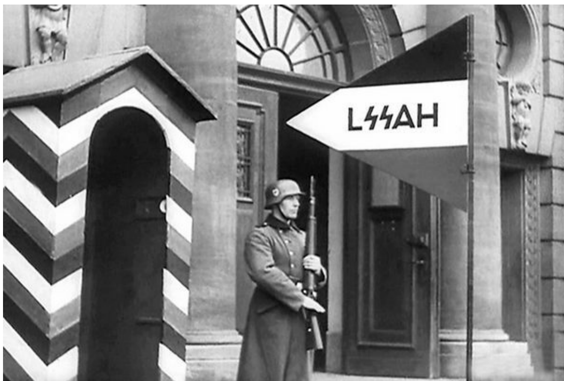
Часовой Лейбштандарта СС «Адольф Гитлер» у казармы

«Мы никогда не считали, что солдатом злоупотребляют. Мы ощущали себя германскими солдатами, которые служат своей стране, защищают ее, неважно где. Никто не хотел ни боев, ни этой кампании, потому что наши родители много рассказывали нам о Первой мировой войне и об ее последствиях. Они нам говорили так: «Если случится еще одна война, это будет конец». А потом в один прекрасный день нам приказывают выступить. И кто-нибудь возразил? Да никто!»