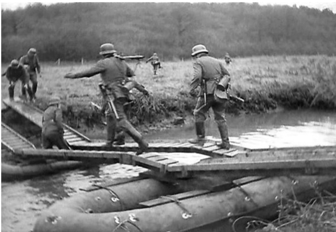
Германские пехотинцы тренируются преодолевать водную преграду

Тактические принципы германской армии особенно славились среди военных и очень хорошо себя зарекомендовали. Их суть состояла в предоставлении командирам максимальной свободы при выполнении четко поставленных задач, развитии инициативы у штабных работников всех уровней. Генерал Эрих фон Манштейн, командующий корпусом, также считал, что победа во Франции целиком и полностью зависела от неспособности неприятеля противостоять немецким танковым силам. Уроком этой кампании стало то, что и в армиях других стран начали переходить к нанесению массированных ударов танковыми клиньями, активно использовать авиацию для поддержки наземных сил. И времена легких побед канули в Лету. После серьезных поражений начального этапа кампании французские дивизии героически сражались под Дюнкерком, оказываясь даже в безвыходных ситуациях. Ко времени окончания боев на Западе германские войска потеряли четверть своих танковых сил – 683 танка, а также убитыми – 26 455 человек, ранеными – 111 640 и пропавшими без вести – 16659. Так что не такой уж веселой и безоблачной оказалась эта «прогулка» по Франции.