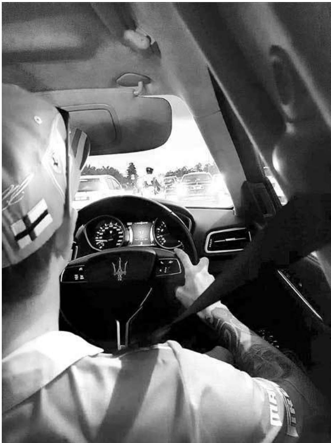
Пристроились за кортежем министра. В машине с Кими в Куала-Лумпуре.

Одна из женщин, та, что с рыжими волосами, спрашивает, не меня ли они бесили прошлым вечером. Я отвечаю, что меня в баре не было, поэтому у них еще есть шансы на это. Мужчина с оспинами на красном лице грубовато интересуется, являюсь ли я фанатом Кими или того британца с сережками в ушах. По его мнению, я выгляжу как фанат Льюиса Хэмилтона. Я говорю, что я гетеросексуал и ни за кого не болею. Женщины смеются, чувствуя облегчение от того, что они бесили не меня.