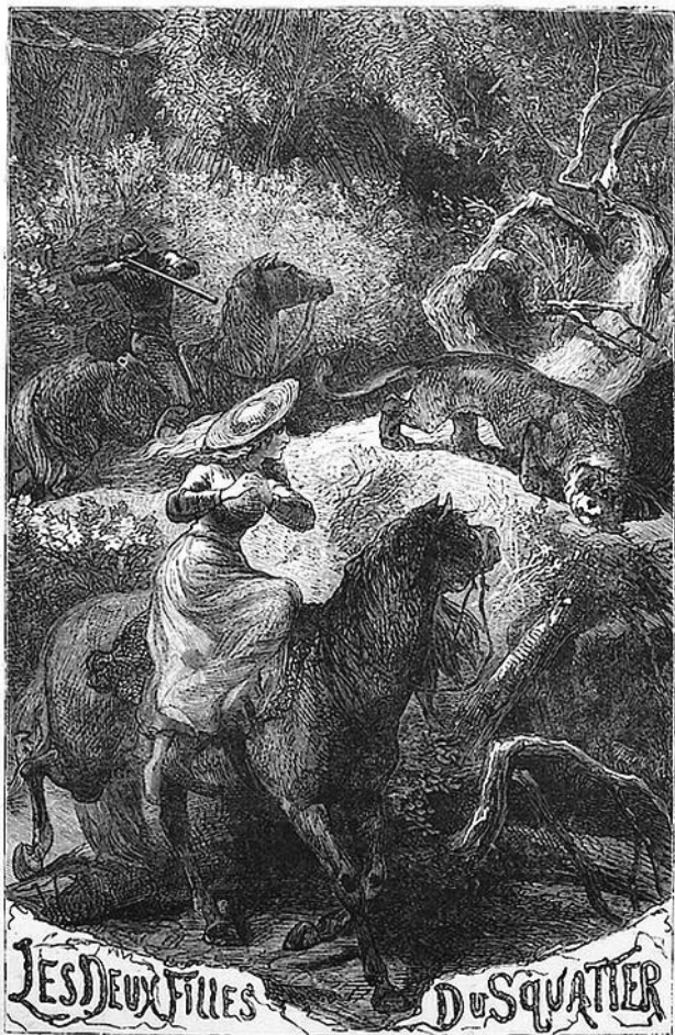
LES DEUX FILLES DU SQUATTER