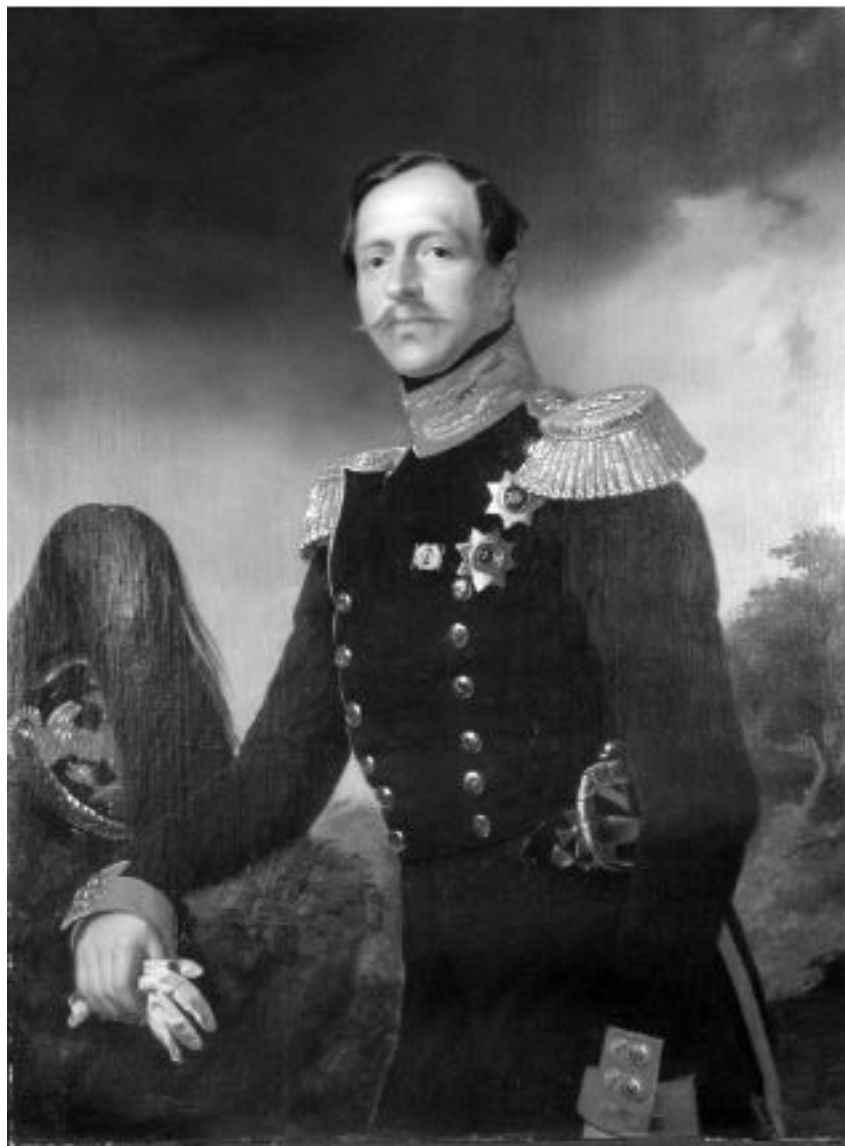
1. Принц П.Г. Ольденбургский. 1850-е гг.