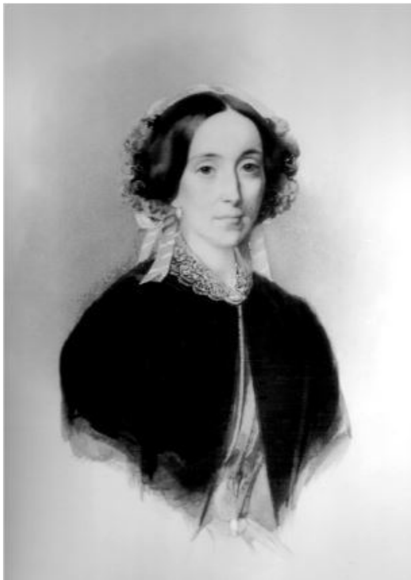
2. Принцесса Тереза Ольденбургская. 1850-е гг.

В 1829 году умерли его дед, герцог Петр Фридрих Людвиг и старший брат – Александр. В этом же году принц Петр был неожиданно выдвинут определенными европейскими политическими кругами кандидатом на греческий престол в связи с предоставлением Греции независимости в результате Адрианопольского мирного договора (14 сентября 1829 г.) после завершения русско-турецкой войны 1828–1829 г. Однако этот проект не осуществился.