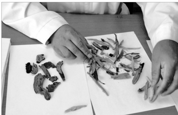
Эти корни – сокровища Вьетнама