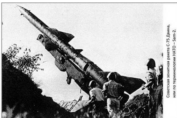
Советская зенитная ракета С-75 Двина, или по терминологии НАТО – Sam-2.