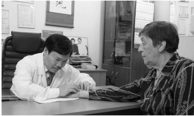
На нижнем снимке: пульсовая диагностика.