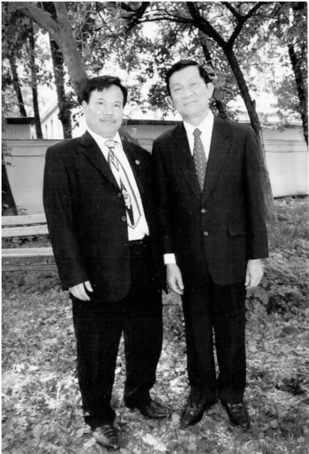
Доктор Тхан Ван (Дык) Тай [слева] и президент Республики Вьетнам с 2011 по 2016 гг. Чьонг Тан Шанг.