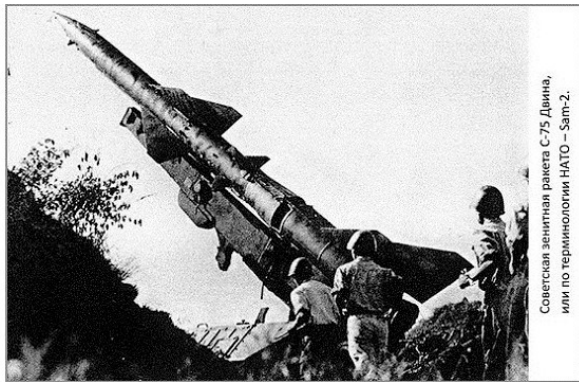
Советская зенитная ракета С-75 Двина, или по терминологии НАТО — Sam-2.