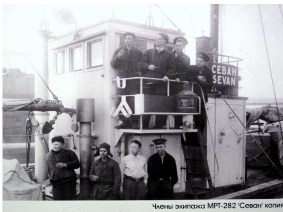
Экипаж МРТ – 282 «Севан».