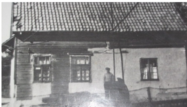
Первая контора рыбзавода.