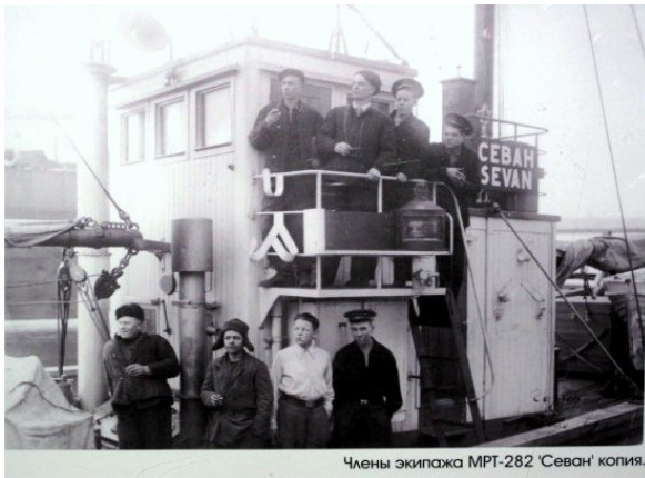
Члены экипажа МРТ-282 'Севан' копия.