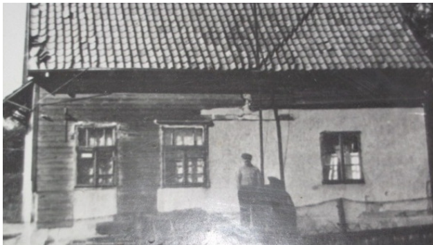
Первая контора рыбзавода.