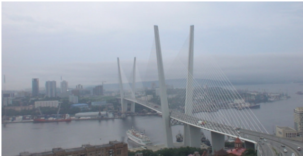
Туман над Золотым мостом Владивостока.