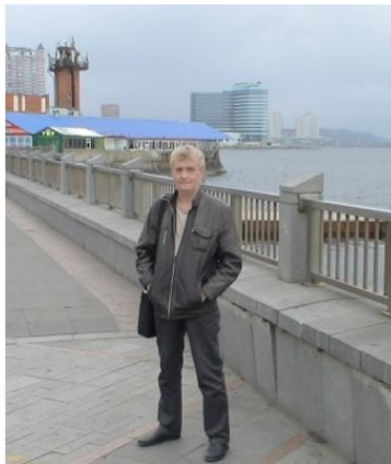
А. Ардашев. Набережная Владивостока.