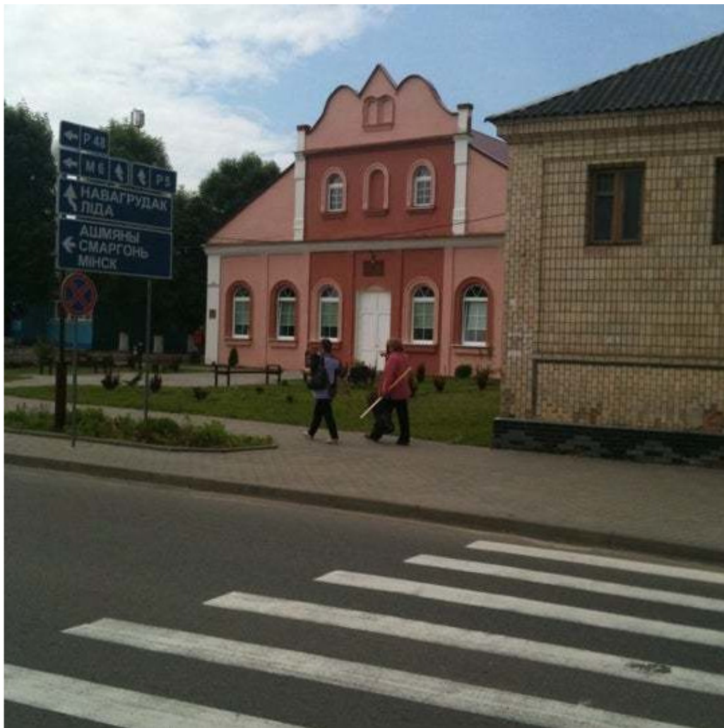
Ивьевская синагога.