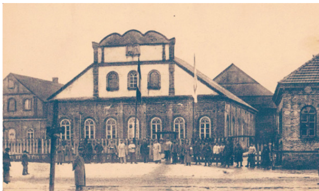
Синагога в Ивье. Старая фотография.

Книга имеет образовательный и культурный характер.