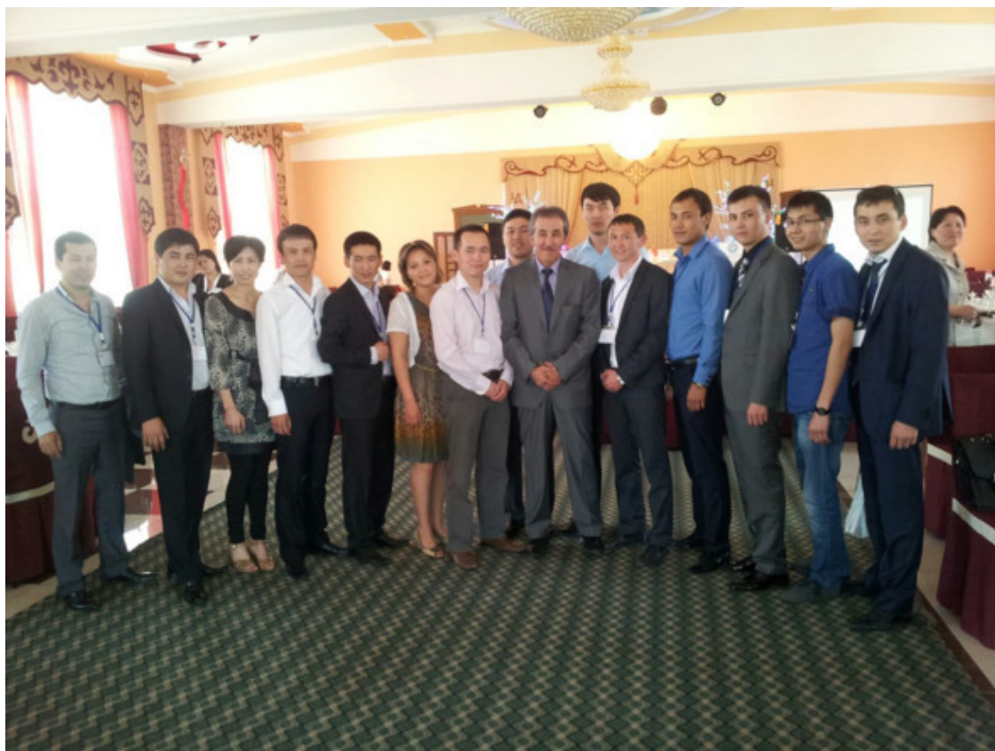
Среди клинических ординаторов и аспирантов НИИХСТО (2005—2011гг)