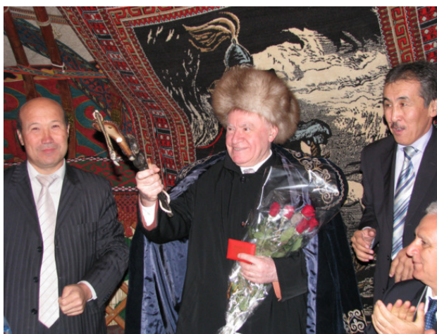
Камча в руках лучшего кардиохирурга на планете

2009 г. Вручение правительственной награды – медали «Данк» -Президентом Кыргызской Республики К. Бакиевым за большой вклад в развитие кардиохирургии страны.