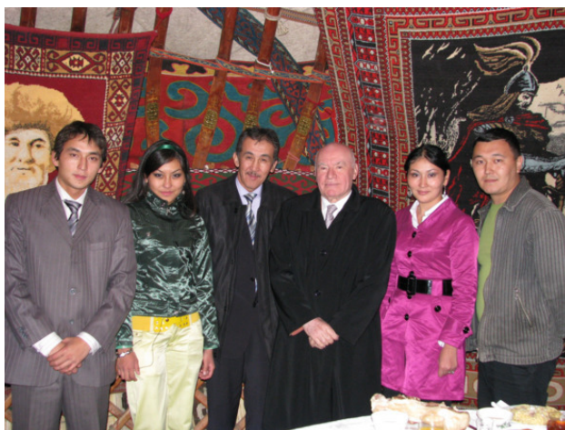
Учитель с родными Ученика