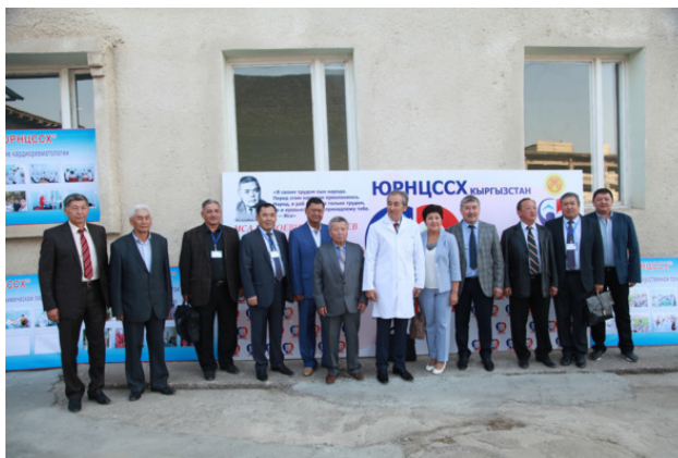
Участники международной конференции в ЮРЦСС, приуроченной 110-летию Исы Ахунбаева, 2018-й год, Жалал-Абад.