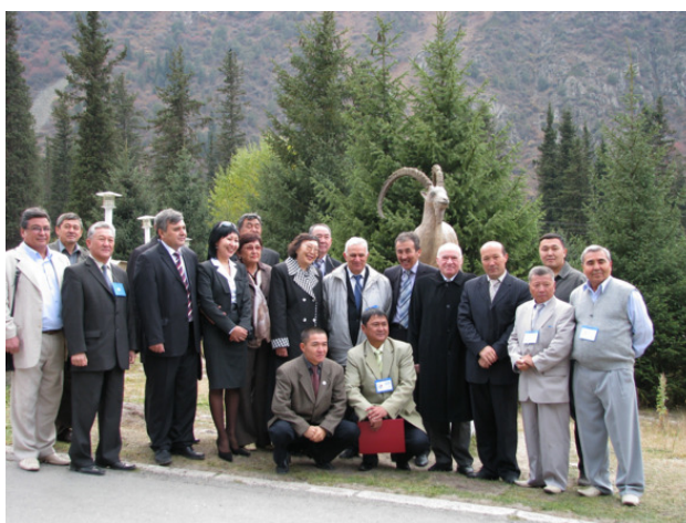
В ущелье Ала-Арча

2006 г. Золотой орден «Гордость России».