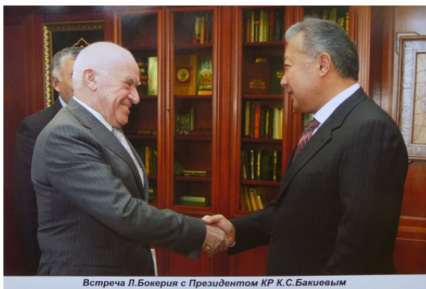
Встреча Л. Бокерия с Президентом КР К. С. Бакиевым

«У меня к сердцу очень трепетное отношение. Более прекрасного создания я не представляю...»