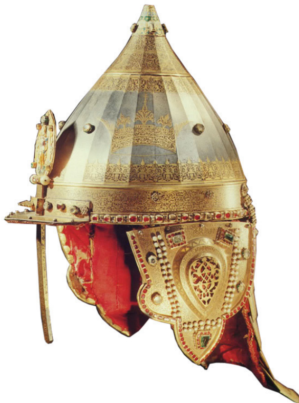
Рис. 1 Рис. 2.

Остроконечный шолом с бармицей Остроконечный шлем с наушами.