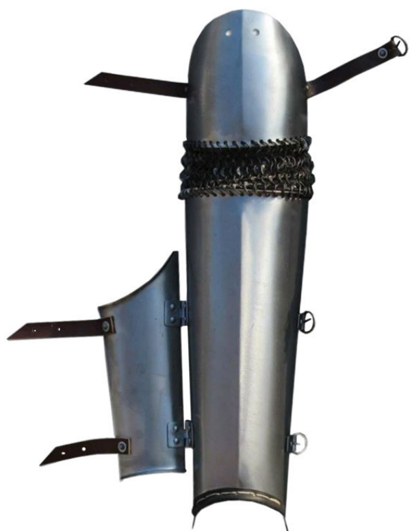
Рис. 7 Рис.8 Наруч. Понож.

Как и в Европе, поверх кольчуги могли надеваться холщовые балахоны с разного рода отличительными знаками.