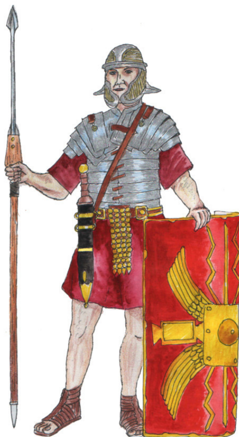
Рис. 1 Рис. 2 Спартанский воин в коротком красном плаще Римский легионер