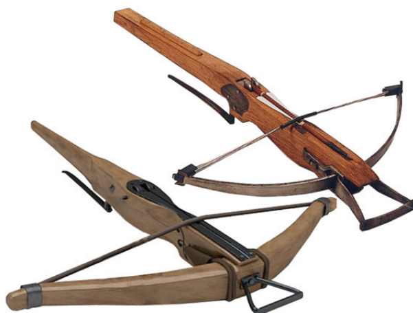
Рис. 14 Разновидности арбалетов.

Снарядом и для лука и для арбалета служила стрела – круглое, продолговатое древко, снабженное стальным, заостренным наконечником с одной стороны и оперением для другой. Тяжелый наконечник стрелы, кроме того что служил проникающим и поражающим элементом, наряду с оперением являл собой и элемент стабилизации стрелы в полете ( рис. 15 ).