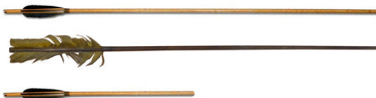
Рис. 15 Стрелы (внизу от арбалета).

Снарядом и для лука и для арбалета служила стрела – круглое, продолговатое древко, снабженное стальным, заостренным наконечником с одной стороны и оперением для другой. Тяжелый наконечник стрелы, кроме того что служил проникающим и поражающим элементом, наряду с оперением являл собой и элемент стабилизации стрелы в полете ( рис. 15 ).