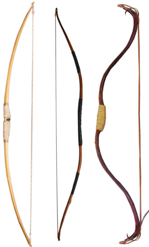
Рис. 13 Разновидности луков.

Еще одним представителем метательных орудий был арбалет. В принципе, это был тот же лук, снабженный только прикладом и пусковым механизмом, суть которого сводилась к фиксации натянутой тетивы и отпущения ее при помощи рычага ( рис. 14 ).