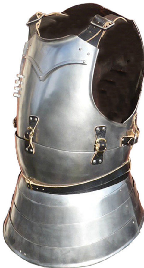
Рис. 4 Рис. 5. Рис. 6

Кольчуга. Кольчуга с зеркалом Цельнометаллический лат.