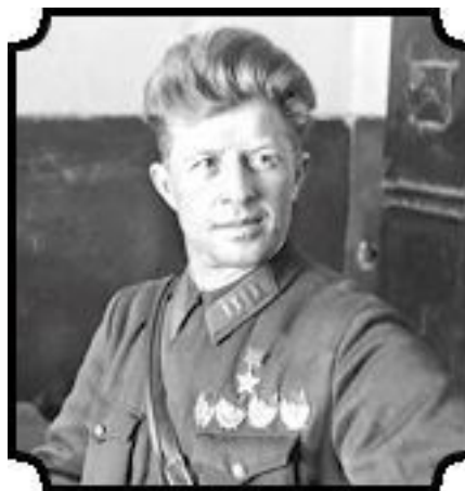
Полковник Александр Ильич Родимцев (1905–1977)