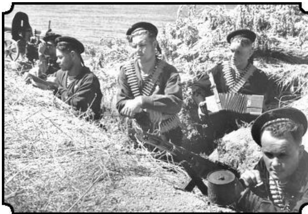
Морские пехотинцы с эсминца «Шарман» под Одессой. Август 1941 года