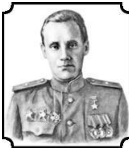
Арнольд Константинович Мери (1919–2009)