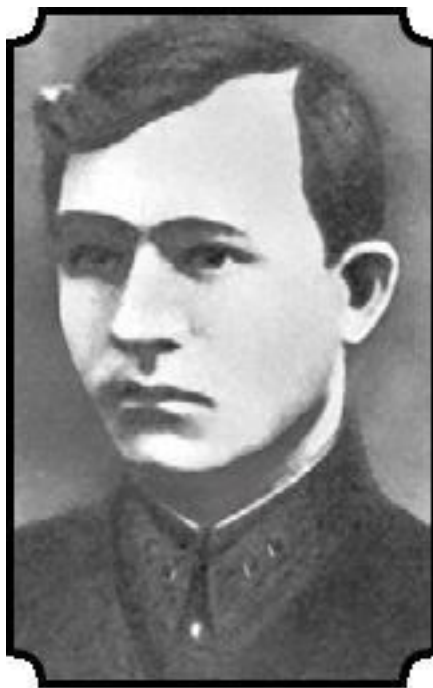
Андрей Митрофанович Кижеватов (1907–1941)

Вечером в подвал пришла дочь одного из военнослужащих. Немцы взяли ее в плен, но решили использовать девушку в качестве парламентаря. Она передала пограничникам требование сдаться в плен. Советские солдаты ультиматум отвергли. Затем прилетели самолеты. Они безнаказанно бомбили крепость, они хотели сровнять ее с землей. Они ее уничтожили. Но не уничтожили они защитников Брестской крепости, давно доложив начальству о ее взятии.