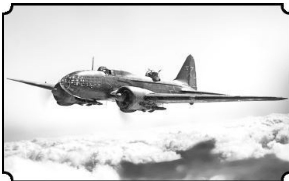
Дальний бомбардировщик ДБ-3ф (Ил-4) конструкции С. В. Ильюшина

В это время советские бомбардировщики прорвались сквозь зону ПВО, полетели над морем, снизились до 4000 метров и сняли кислородные маски. Дышать стало легче.