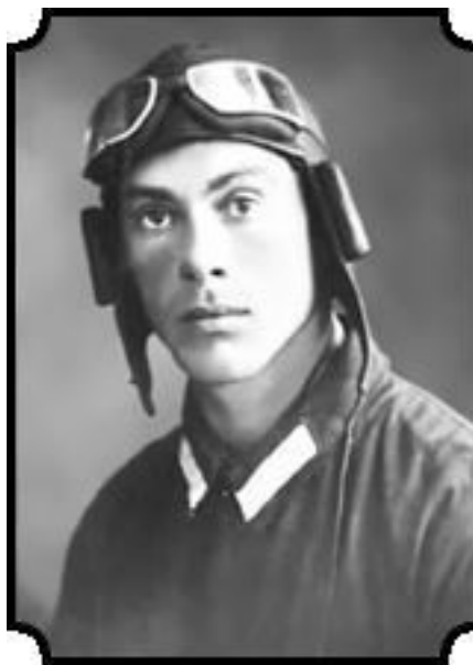
Николай Францевич Гастелло (1907–1941)