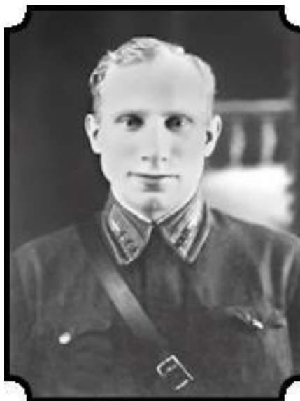
Иван Иванович Иванов (1909–1941)