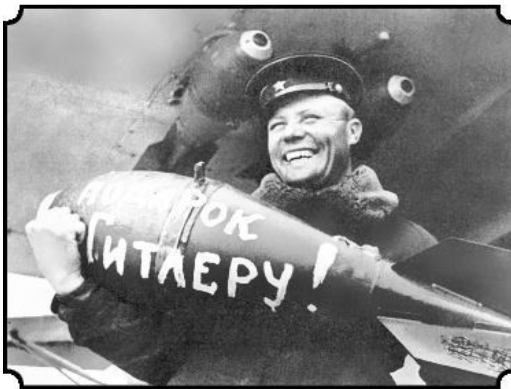
Авиабомба — «подарок Гитлеру»