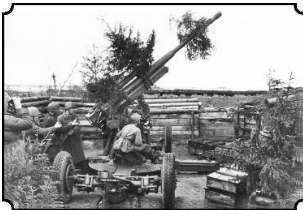
На подступах к Ленинграду

Фон Лееб прорвал оборону 8-й и 11-й советских армий и ринулся на восток. Удар танковой группы немцев был неожиданным для советских военачальников. Они потеряли связь между войсками, и теперь все зависело от тех, кто непосредственно отражал атаки захватчиков. Солдаты и офицеры дрались до последнего патрона, снаряда, – как и везде.