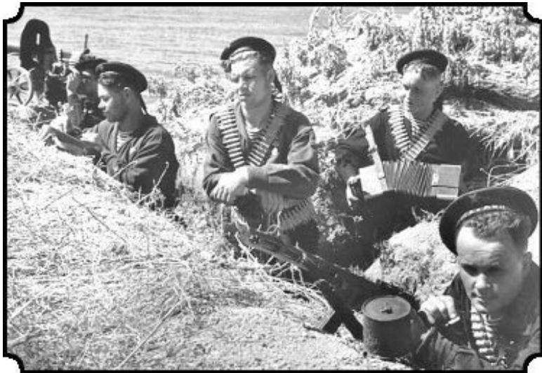
Морские пехотинцы с эсминца «Шумяки» под Одессой Август 1941 года

Морские пехотинцы с эсминца «Шумяки» под Одессой. Август 1941 года