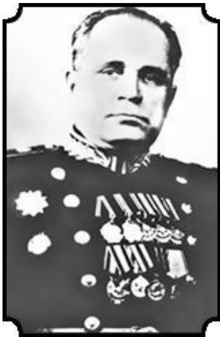
Иван Иванович Затевахин (1901–1957)