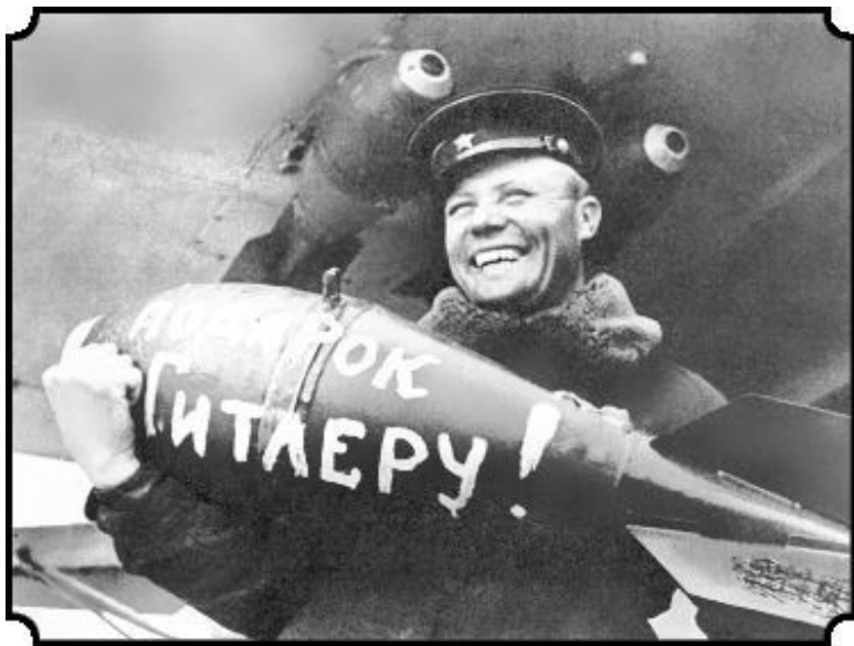
Авиабомба — «подарок Гитлеру»