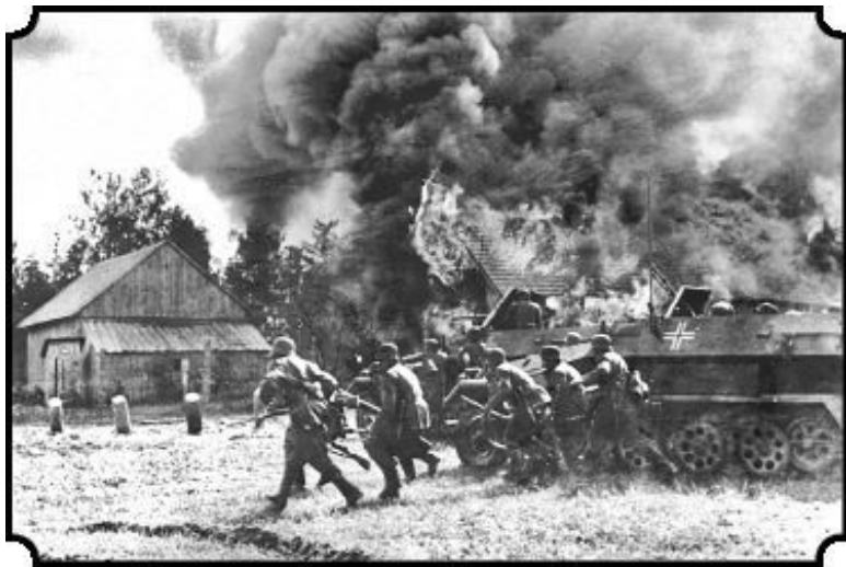
Немецкие солдаты при поддержке бронетранспортера вступают в горящую белорусскую деревню. 26 июня 1941 года

ва. Народный комиссар обороны Маршал Советского Союза С. К. Тимошенко поставил фронтам задачу нанести 23-го и 24 июня контрудары по флангам противника на сувалкском и люблинском направлениях и взять Сувалки и Люблин. Советские танкисты ринулись в бой на шяуляйском направлении и на гродненском направлении.