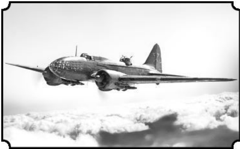
Дальний бомбардировщик ДБ-3ф (Ил-4) конструкции С. В. Ильюшина