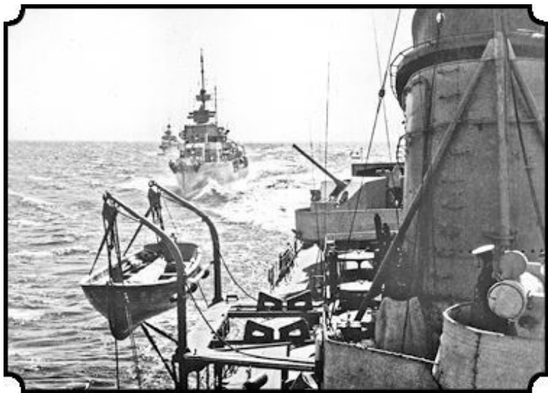
Эсминцы Балтийского флота идут строем пеленга. 1941 год

Море бывает разным. Все герои того перехода знали это. Немцы перешли в наступление на Ленинград. Части Красной армии и ополченцы вели жестокие бои с агрессором. В городе на счету каждый солдат, каждое ружье, каждая пушка. Да, Таллин пришлось оставить – плохо. Но если фашисты возьмут Ленинград, то будет совсем худо. Нужно прорваться в город. Это невозможно – но так надо. Надо.