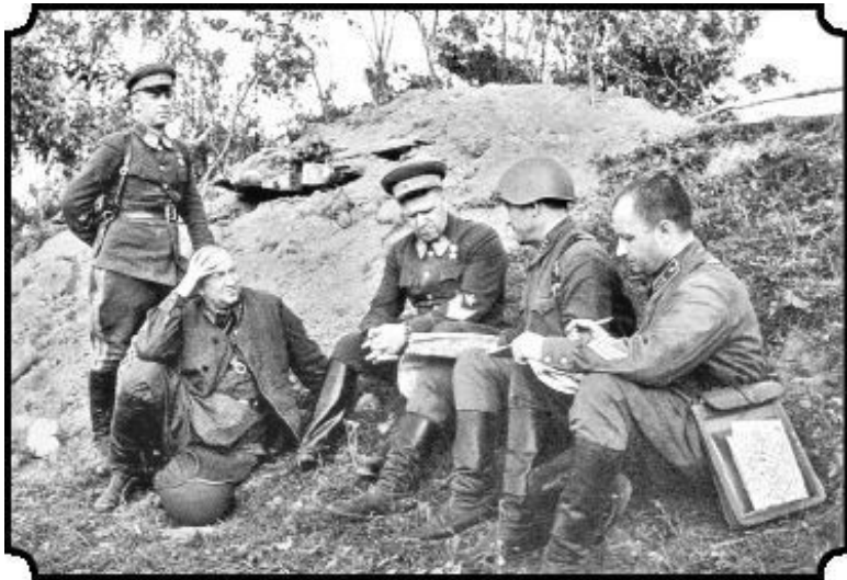
Г. К. Жуков на фронте. Июль 1941 года