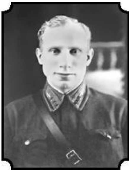
Иван Иванович Иванов (1909–1941)