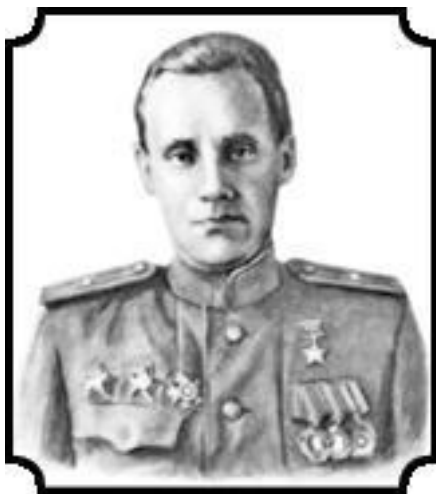
Арнольд Константинович Мери (1919–2009)

ход. Каждый пограничник нес личное оружие, боеприпасы, продовольствие (как минимум на неделю!), кроме этого, поровну были распределены станковые пулеметы, минометы, рации, катушки с кабелем, ящики с патронами и гранатами.