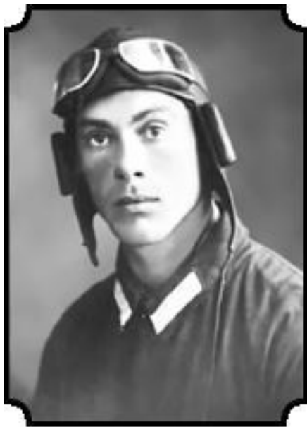
Николай Францевич Гастелло (1907–1941)

атака – еще одно ранение, и вновь враг отошел.