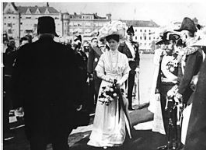
Николай II со своей супругой в Швеции 26 июня 1909 г.

Несмотря на неприятный инцидент, Николай II не прервал свой визит в Швецию. С 30 июня по 5 июля император в Стокгольме несколько раз встречался с Густавом V в радужной обстановке. Тем самым руководители двух стран подчеркивали, что между Швецией и Россией не существует политических разногласий, а только взаимное доверие.