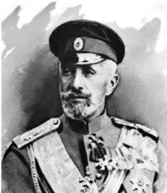
Великий князь Николай Николаевич

ства. С точки зрения юридической техники «Наставление» было значительно более совершенно, чем «Положение о контрразведывательных отделениях», и состояло уже из разделов, глав и статей. Первый раздел являлся как бы общей частью «Наставления». По объему оно в 5 раз превосходило «Положение о контрразведывательных отделениях».