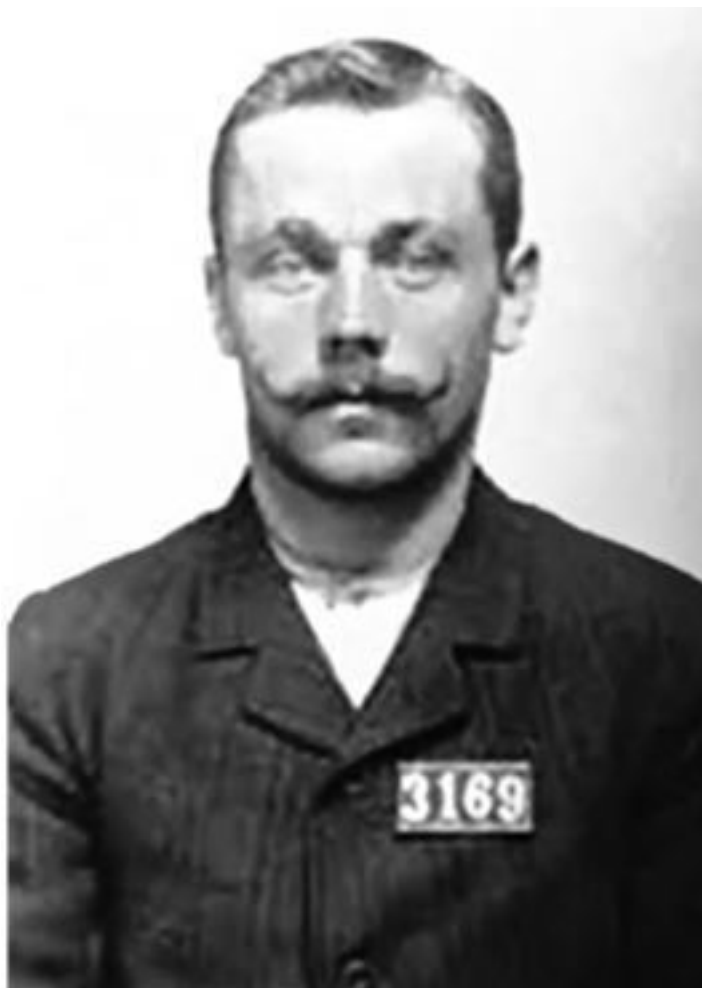
Эдвард Август Орнет

Получаемая от секретного агента информация и ориентировки на лиц передавались в Финляндское жандармское управление. Там в соответствии с утвержденной формой отмечалась сущность агентурной информации, какие были приняты меры, а также содержалась другая информация, выявленная в ходе оперативной разработки. Всё это объединялось в единое дело. Начальник Финляндского жандармского управления в донесениях всячески сохранял персональные данные секретного агента.