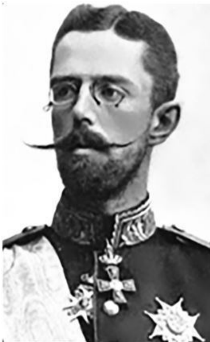
Шведский король Густав V