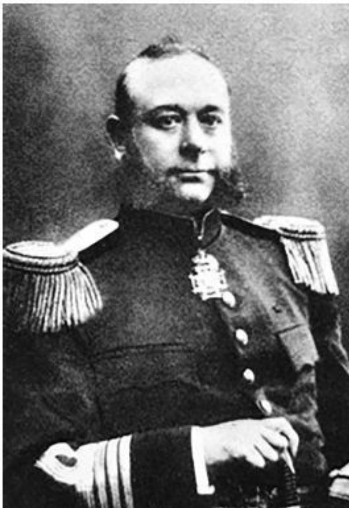
Отто Людвиг Бекман

Справедливости ради следует отметить, что политическая полиция всё-таки была сильно скована в своей деятельности за границей. У всех был на памяти грандиозный скандал, который поднялся в печатных изданиях разных стран Европы в 1904 г. в связи со вскрытием фактов разведывательной деятельности заграничной агентуры Департамента полиции в Ватикане. Эта малоизвестная страница в истории дореволюционных отечественных спецслужб. Краткая суть её заключается в том, что сразу два секретных агента с 1901 г. вошли в окружение кардинала Ледовского, координировавшего и направлявшего вплоть до своей смерти антироссийскую деятельность Ватикана в странах Европы и на территории Российской империи.