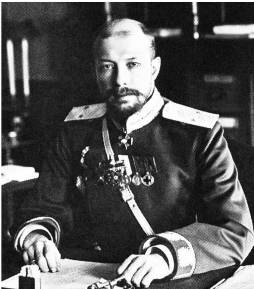
Великий князь Сергей Александрович

К концу 90-х гг. XIX в. социал-демократы от теоретической пропаганды перешли к непрерывной агитации среди рабочих на почве существующих их повседневных нужд и требований. Это дало положительные результаты. Рабочее движение быстро росло 3 .