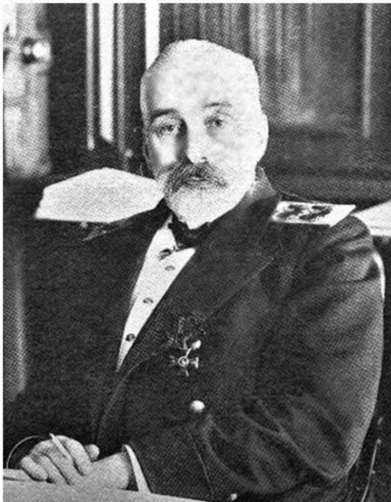
Морской министр адмирал И. К. Григорович