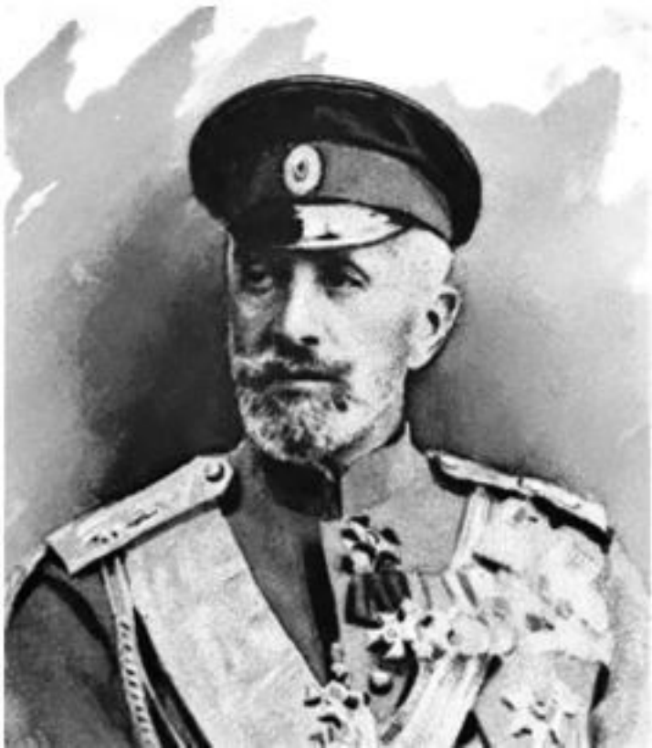
Великий князь Николай Николаевич

Общая цель военной контрразведки по «Наставлению» заключалась «в обнаружении, обследовании, разработке и