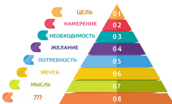
Пирамида трансформации понятий

Я отобразил в виде рисунка, как происходит постепенная трансформация наших рассматриваемых понятий и вот, что у меня получилось.