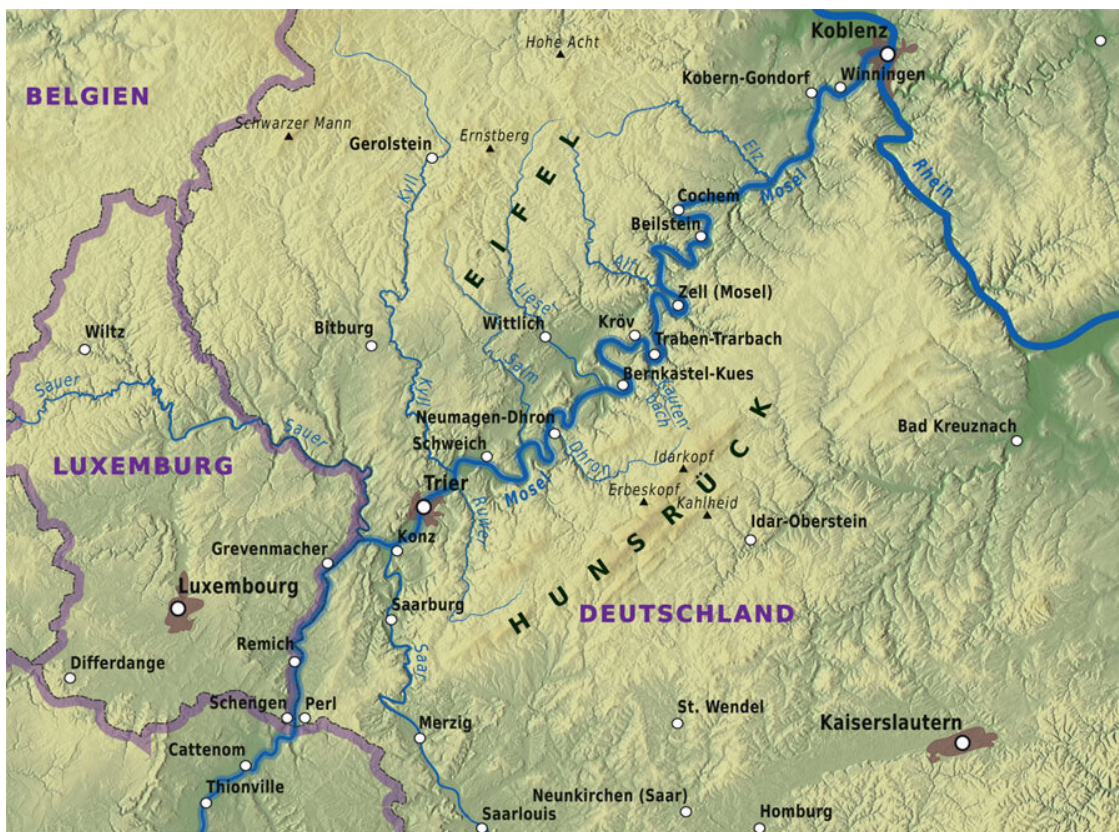
Карта нижнего течения Мозеля (из Википедии).