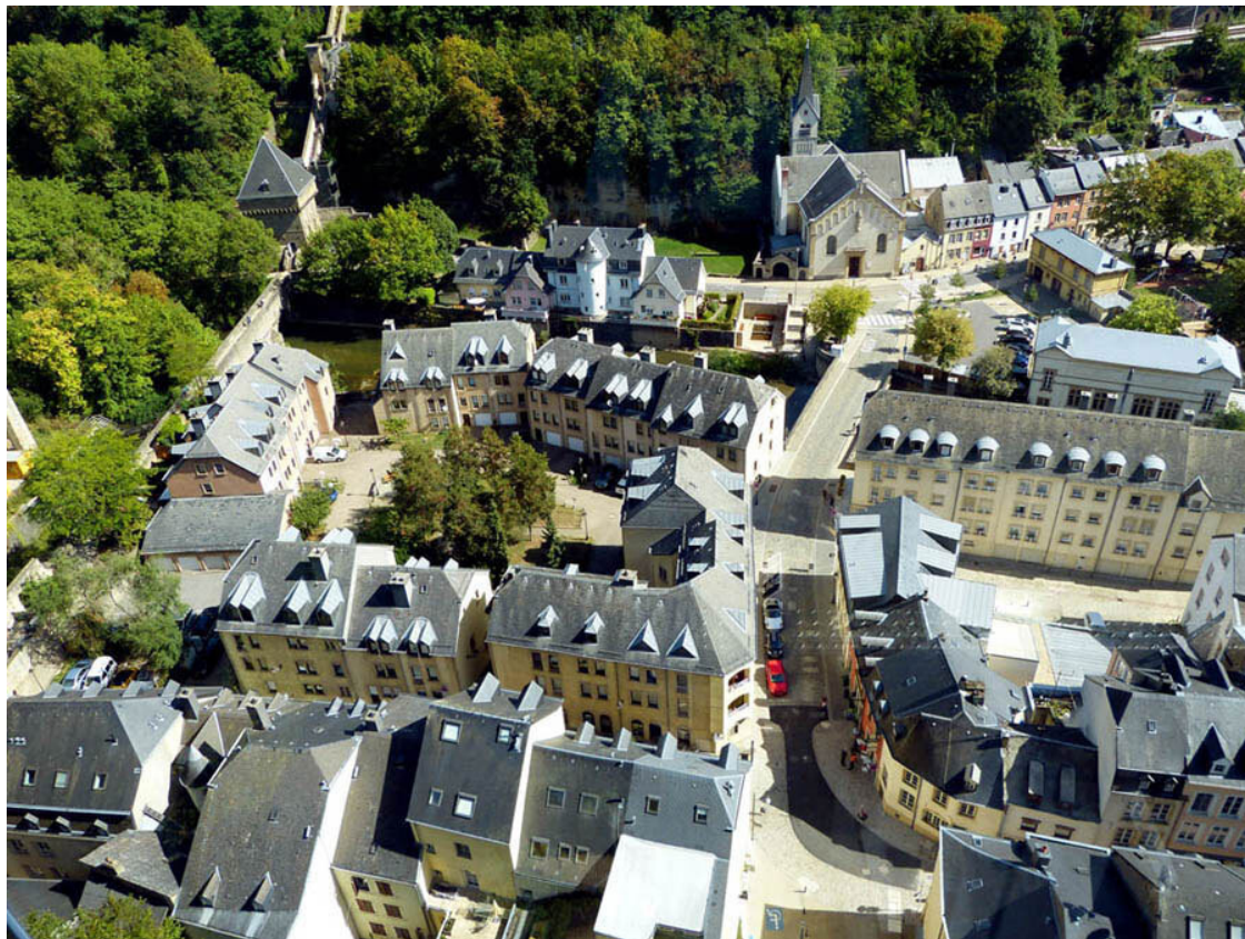
Вид с площадки лифта на старинный квартал Pfaffenthal.

пешеходной галерее со стеклянными стенами над обрывом. Галерея заканчивается смотровой площадкой с прозрачным полом и круговым обзором. Отсюда открывается шикарный вид на долину реки Альзет и на старинный квартал Pfaffenthal. Севернее, на высоте 74 метра над рекой, пролегает красный мост Великой герцогини Шарлотты, открытый в 1966 году.