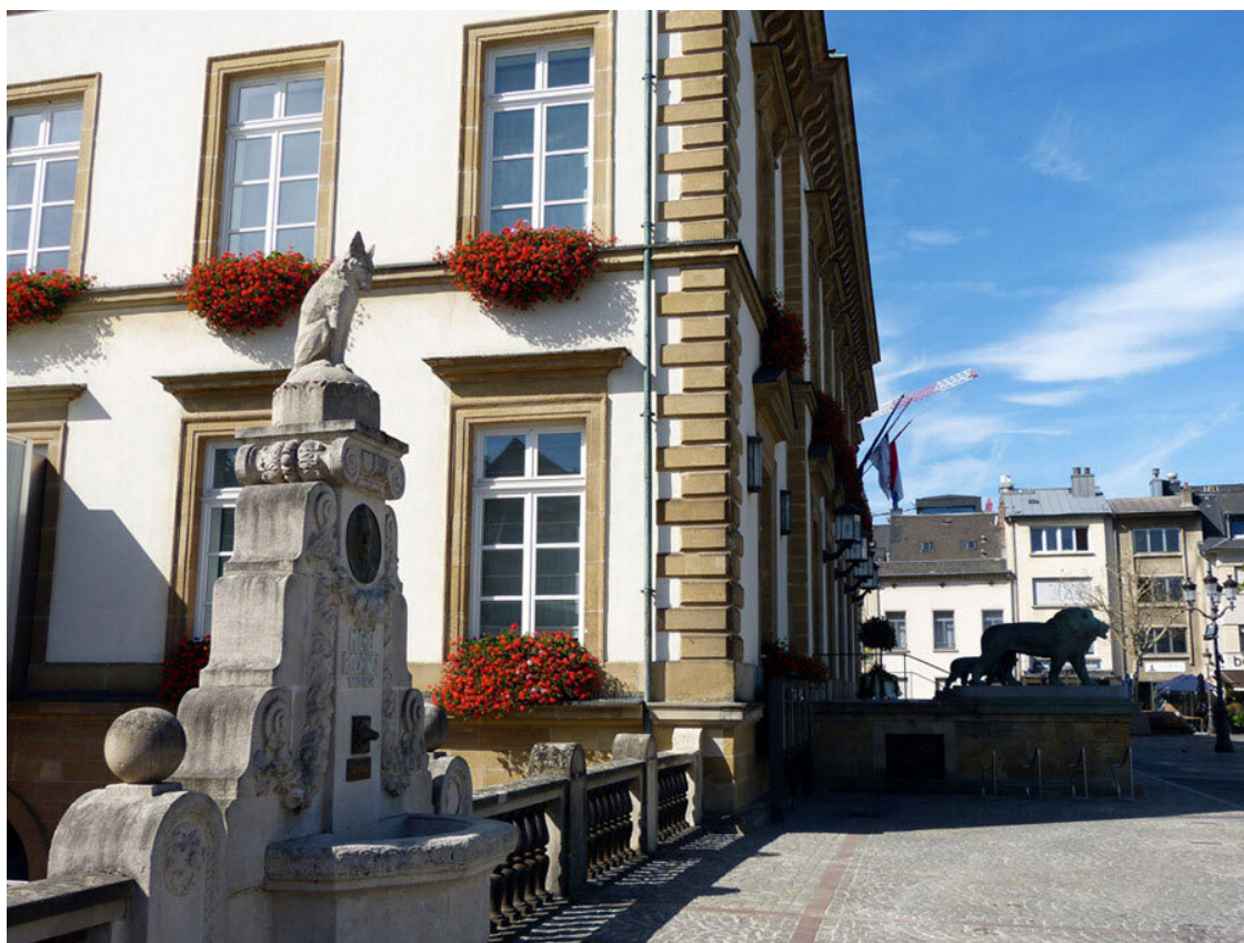
Place Guillaume II, памятник Мишелю Роданжу и ратуша Люксембурга.

Но гораздо интереснее другой памятник, поменьше, который расположился слева от ратуши. Это белый треугольный постамент, на котором стоит всё тот же печальный лис Ренар. «Роман о Лисе» сочинили во Франции в XII–XIV веках. Основной сюжетной линией произведения является победоносная борьба умного Ренара с грубым и кровожадным волком Изенгримом и с сильным и глупым медведем Бренем. Лис обводит вокруг пальца Льва Нобля (короля), постоянно насмеяется над глупостью Осла Бодуэна (священника). В 1872 году вышла книга «Ренар или Лис в человеческом обличии», написанная Мишелем Роданжем на люксембургском языке. Ныне считается, что это высшее достижение местной литературы в XIX веке. В 1932 году Мишелю Роданжу поставили памятник возле ратуши Люксембурга.