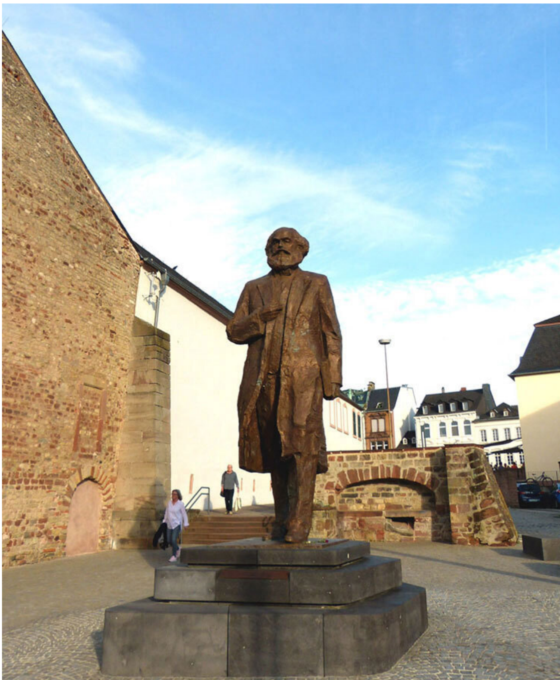
Памятник Карлу Марксу в Трире, подаренный властями КНР.

Неподалёку, на расстоянии семидесяти метров от памятника, но с обратной стороны, по адресу Simeonstrabe 8, находится маленький домик, который когда-то купили родители Карла Маркса. Семья жила в нём с 1 октября 1819 года до 1850 или 1851 года, т. е. гораздо дольше, чем на Brückengasse 664. Но здесь никакого музея устраивать не стали.