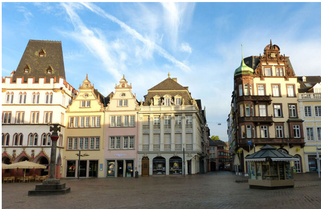
Трир, главная площадь, Hauptmarkt.

На площади шёл концерт. Кто-то пел, затем танцевал, потом зазвучала музыка Чайковского. Оказалось, что именно в этот день, 8 сентября, в городе проходила «Ночь музеев» и общегородская игротека. К какому из этих двух мероприятий относился концерт на Hauptmarkt, я сказать затрудняюсь, но народу там было очень много. В какой-то момент послышалась музыка из мультфильма про кота Леопольда. «Там русский дух... там Русью пахнет!»