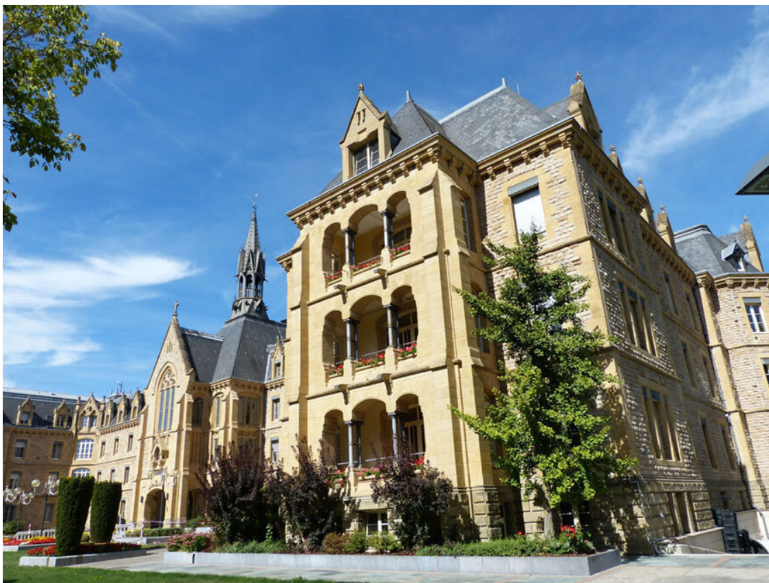
Дом престарелых (Fondation Pescatore).

Комплекс зданий оказался домом престарелых, основанным на деньги табачного магната и филантропа Жана-Пьера Пескаторе (Fondation Pescatore). Построили его в 1886–1892 годах из железобетона, но так хорошо обложили натуральным камнем, что выглядит он почти как рыцарский замок.