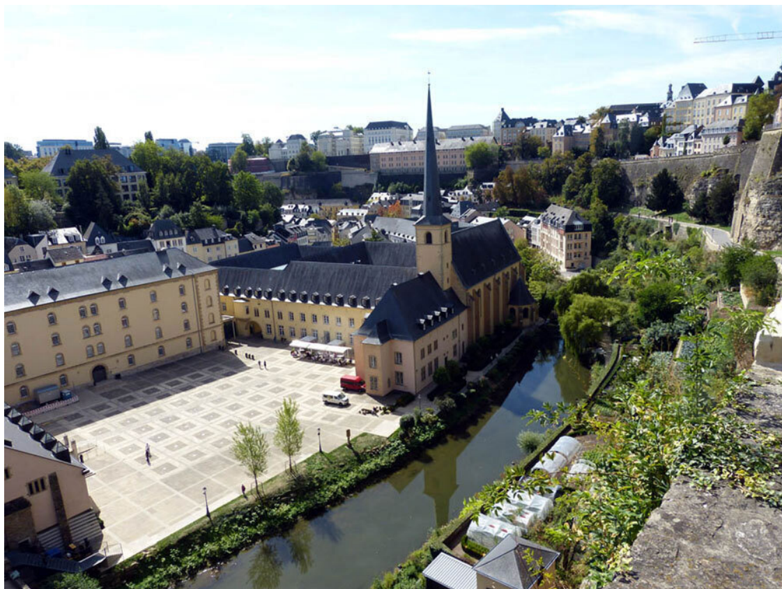
Вид со скалы Бок на Grund.

Понятно, что древнеримская дорога проходила по каменному перешейку в долине Альзета и являлась единственной возможностью попасть на мост через него. Понятно и то, что крепость Люксембург действительно была очень хорошо защищена. Ныне же от укреплений на скале Бок остались лишь развалины. Напомню, что это сделали по условиям Лондонского договора 1867 года. Разрушение крепости заняло 16 лет и стоило полтора миллиона золотых франков, т. е. почти полтонны золота.