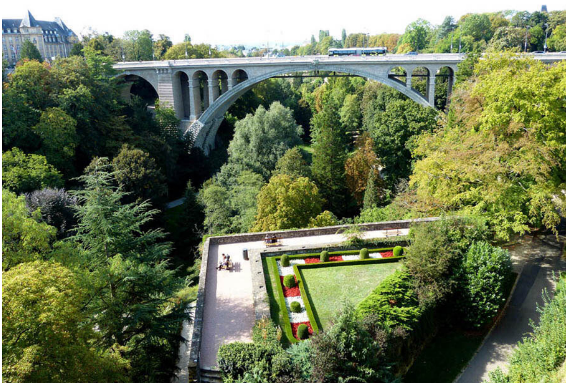
Вид на долину Петруса и на мост Adolphe-Bréck.

Фашисты, оккупировав Люксембург, уничтожили этот монумент в 1940 году, но статую, разбитую на три части, местные жители смогли спрятать. Через много лет Gëlle Fra восстановили и 23 июня 1985 года, в день национального праздника Люксембурга, открыли заново.