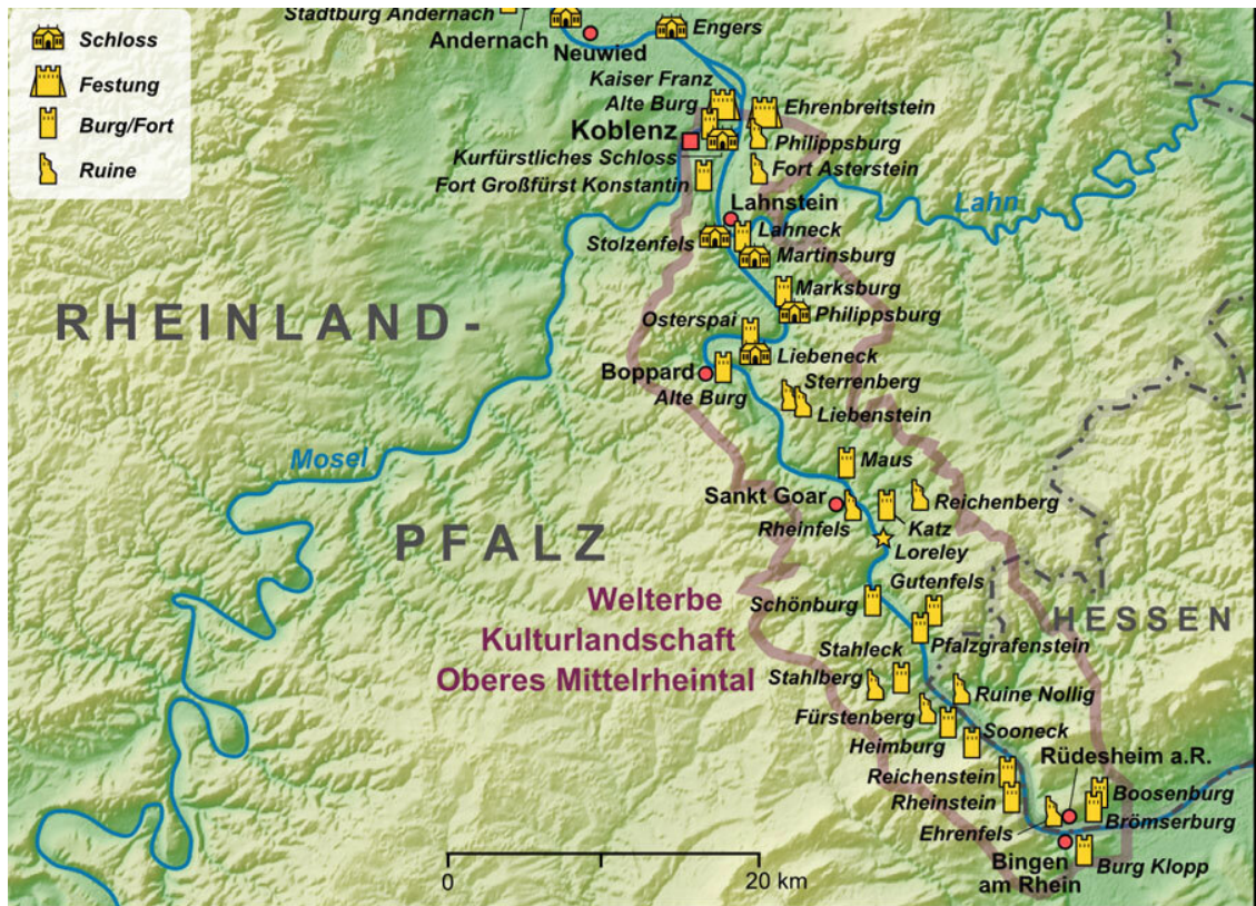
Карта замков Среднего Рейна.