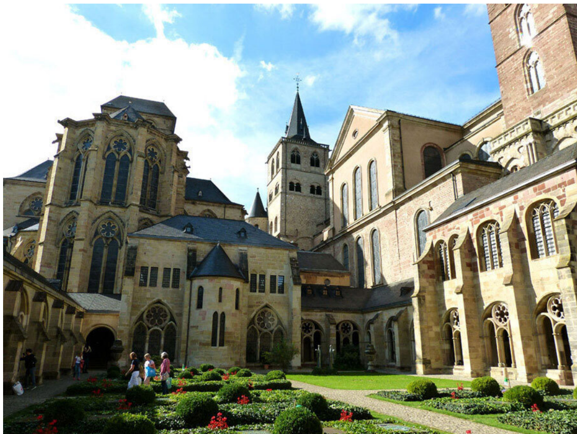
В клуатре Трирского собора.

Вернулись в собор. Осмотрели огромный барочный главный алтарь, а потом обнаружили, что на алтарь можно подняться. Оказалось, что туда проходят через бывшую сокровищницу, ныне являющуюся музеем. Поднялись по лестнице, купили билеты и вышли на площадку главного алтаря. Между двумя мраморными фигурами апостолов Петра и Иоанна там существует отверстие, через которое видна Heiltumskapelle, часовня, построенная в начале XVIII века. Именно в ней хранится главная реликвия собора, Риза Господня. Публике её показывают очень редко.