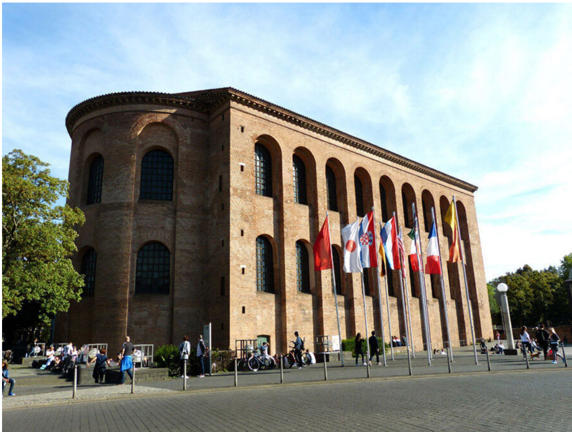
Aula palatina (Базлика Константина) в наши дни.

городом империи к северу от Альп. Полтора века подряд здесь чеканились золотые монеты. Предположительно, в Augusta Treverorum в период максимального расцвета обитало от двадцати до пятидесяти тысяч жителей, хотя некоторые исследователи увеличивают это число до ста тысяч.