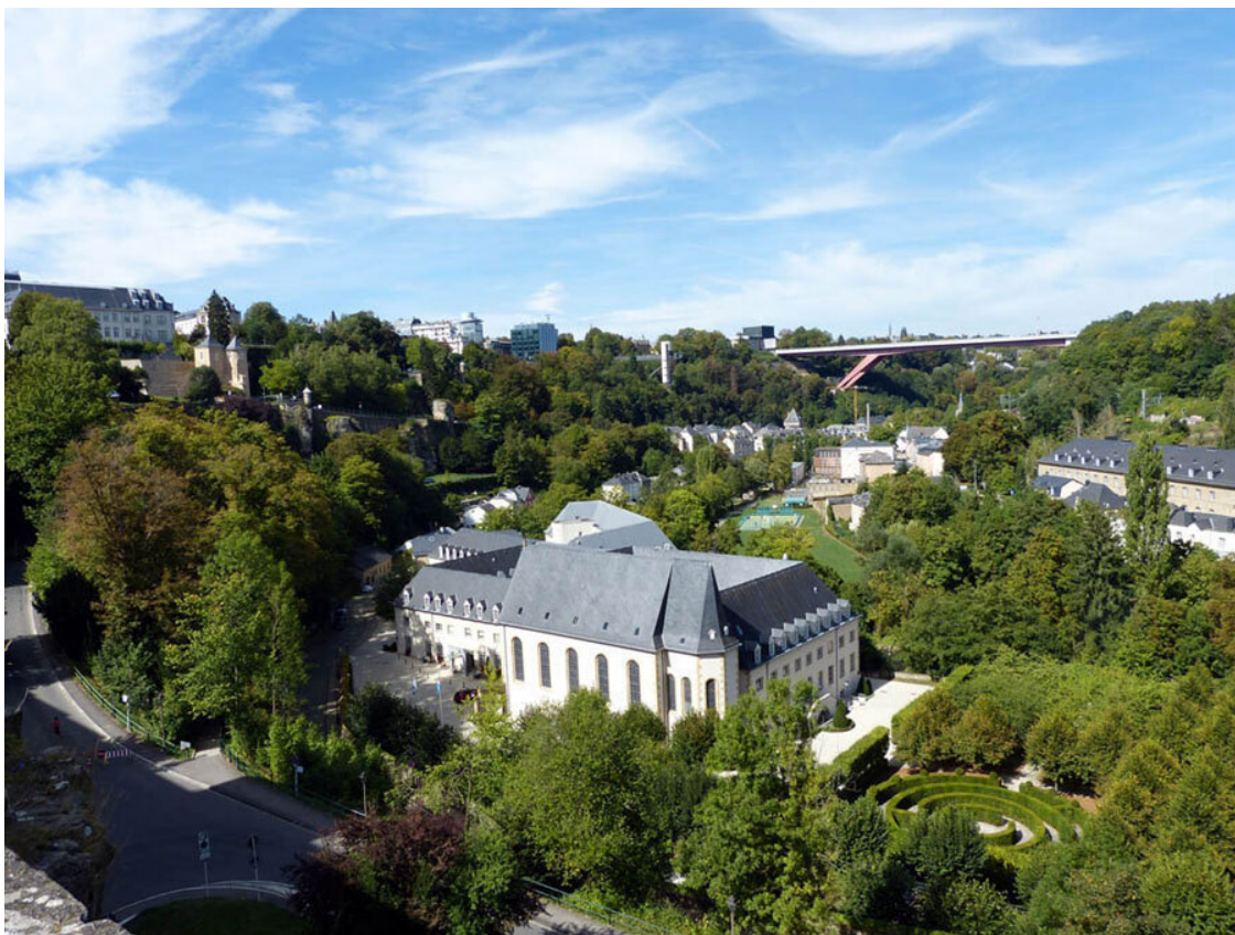
Вид со скалы Бок на Pfaffenthal.

Отсюда шикарный вид и на север, на Pfaffenthal, и на юг, на Grund, тоже расположенный у самой воды.