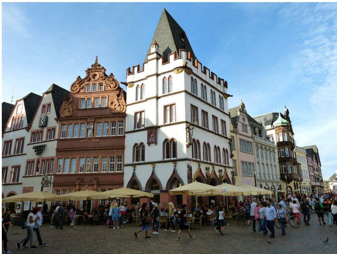
Rotes Haus u Steipe.

Трирского собора Иоганна Вильгельма Полча. А ещё на фронте этого здания выбито изображение легендарного основателя Трира Нинуса Требеты.