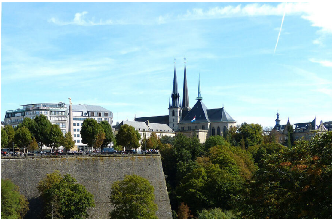
Золотая Дама и собор.

Фашисты, оккупировав Люксембург, уничтожили этот монумент в 1940 году, но статую, разбитую на три части, местные жители смогли спрятать. Через много лет Gëlle Fra восстановили и 23 июня 1985 года, в день национального праздника Люксембурга, открыли заново.