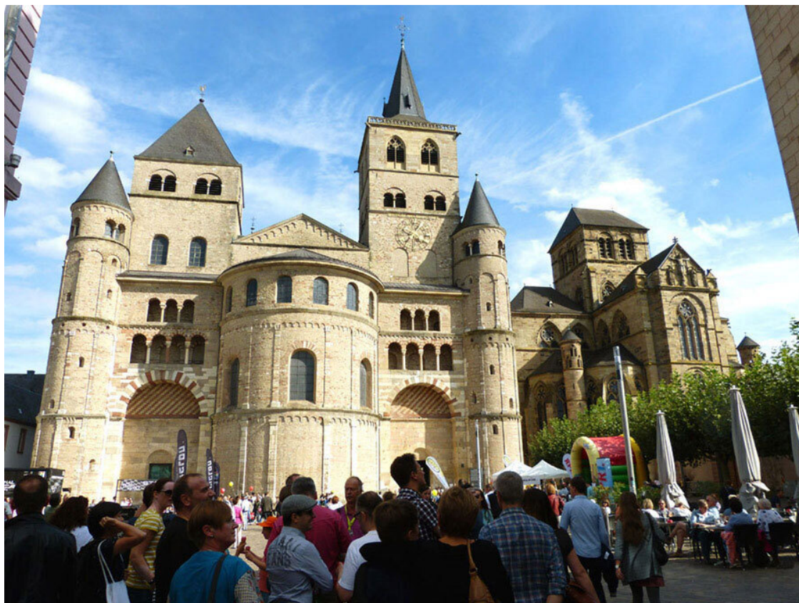
Трирский собор и Liebfrauenkirche.

Покинув собор, мы заглянули в Церковь Пресвятой Девы Марии. Она меня немного разочаровала. Насколько красив этот храм снаружи, настолько он странен внутри. Вероятно, всё дело в реставрации, которая проходила с июля 2008 года по сентябрь 2011 года, а также в том, что все витражи этой готической церкви – современные. Оригинальные были утрачены во время Второй мировой войны.