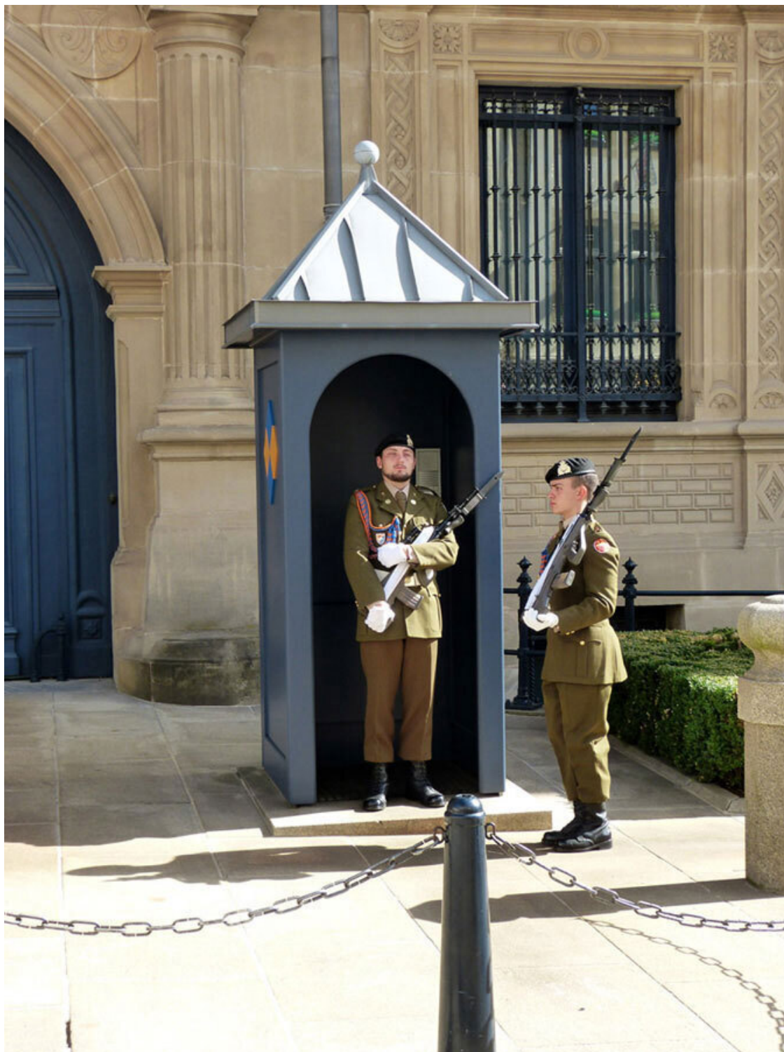
Караульные перед дворцом великого герцога.

Мы обошли дворцовый квартал и обнаружили симпатичный дворик, декорированный под средневековье, Passage du Palais, выходящий на Rue de l'Eau. Спускаешься по ступенькам, а над тобой нависают фахверковые лоджии и полукруглые каменные башни.