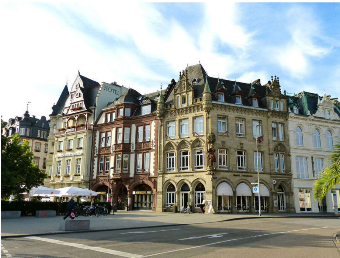
Здания возле Porta Nigra.

Поезд, отправляющийся в 8–37, мы решили пропустить, чтобы не бежать на вокзал. Спокойно прогулялись к Porta Nigra, полюбовались ими при утреннем свете, потом обратили внимание на красивые здания восточнее ворот. Больше всего мне понравился неоготический дом Zum Christophel, построенный в 1895–1897 годах. Его угол на втором этаже украшает изваяние святого Христофора с младенцем Иисусом на спине.