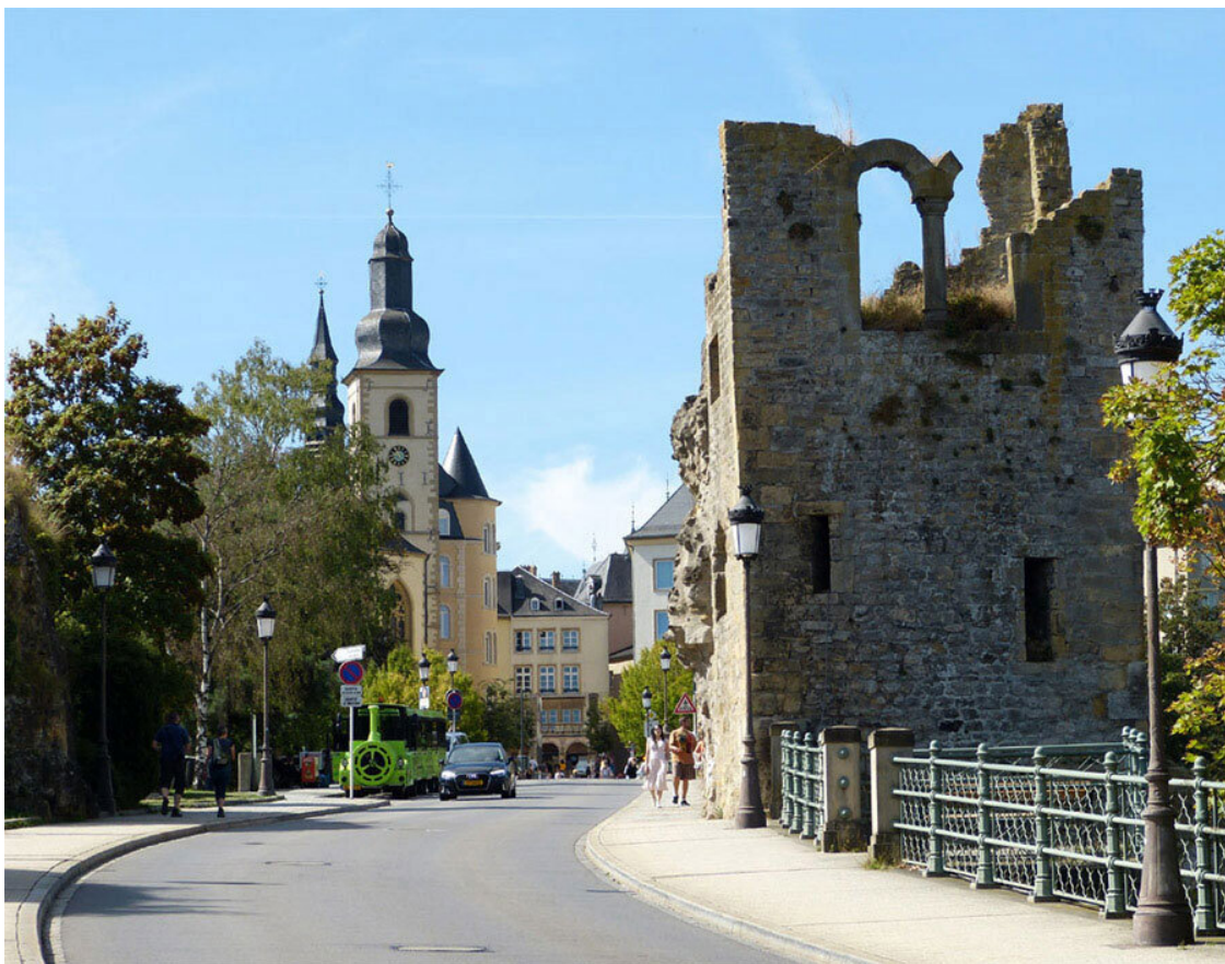
Один из разрушенных корпусов крепости Люксембург.

Налюбовавшись прекрасными видами, мы решили посетить казематы. Их, в отличие от верхней части крепости, никто не трогал. Замковые подвалы существовали с самого основания, но в 1744 году, во времена австрийского владычества, их значительно расширил фельд-маршал фон Нейшперг.