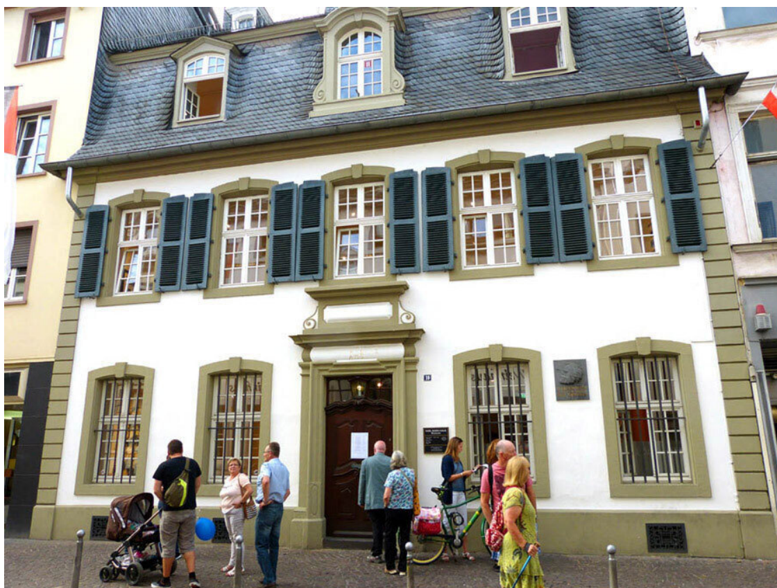
Дом, где родился Карл Маркс.

Фашисты после прихода к власти экспроприировали здание. Ломать не стали, но расположили в нём редакцию нацистской газеты «Trierer Nationalblatt». Во время Второй мировой войны дом не пострадал и уже 5 мая 1947 года в нём был открыт музей Карла Маркса. Говорят, что ныне больше трети его посетителей – китайцы.