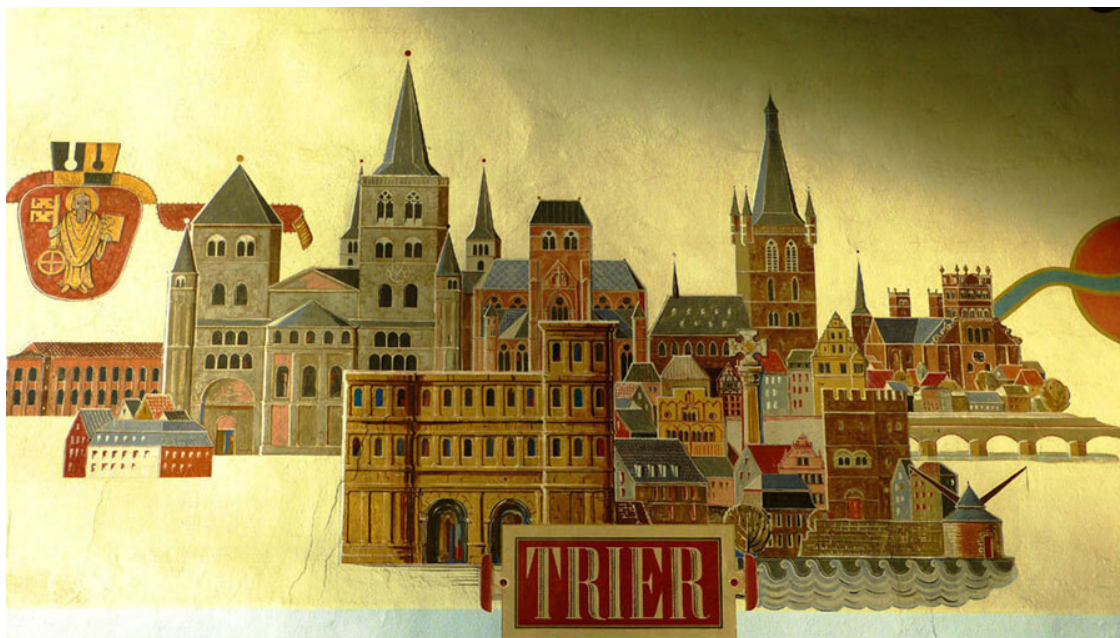
Фреска на стене железнодорожного вокзала в Трире.

На последнем участке пути, как только мы спустились с высокого водораздела, открылась красивейшая долина Мозеля с виноградниками на склонах гор и симпатичными особняками и даже замками на обоих берегах. Сразу стало понятно, что это очень интересная местность. Высадившись в Трире на остановке у железнодорожного вокзала, мы отправились пешком к своей гостинице.