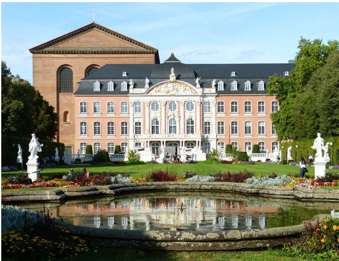
Базилика Константина и резиденция курфюрста.

Французы, оккупировавшие Трир в 1794 году, устроили во дворце казармы. Пруссаки, овладевшие городом в 1814 году, использовали бывшую резиденцию курфюрстов так же. Лишь в 1955 году после капитального ремонта и реставрации во дворец въехали местные власти. Поэтому попасть в это здание можно лишь по предварительной записи.