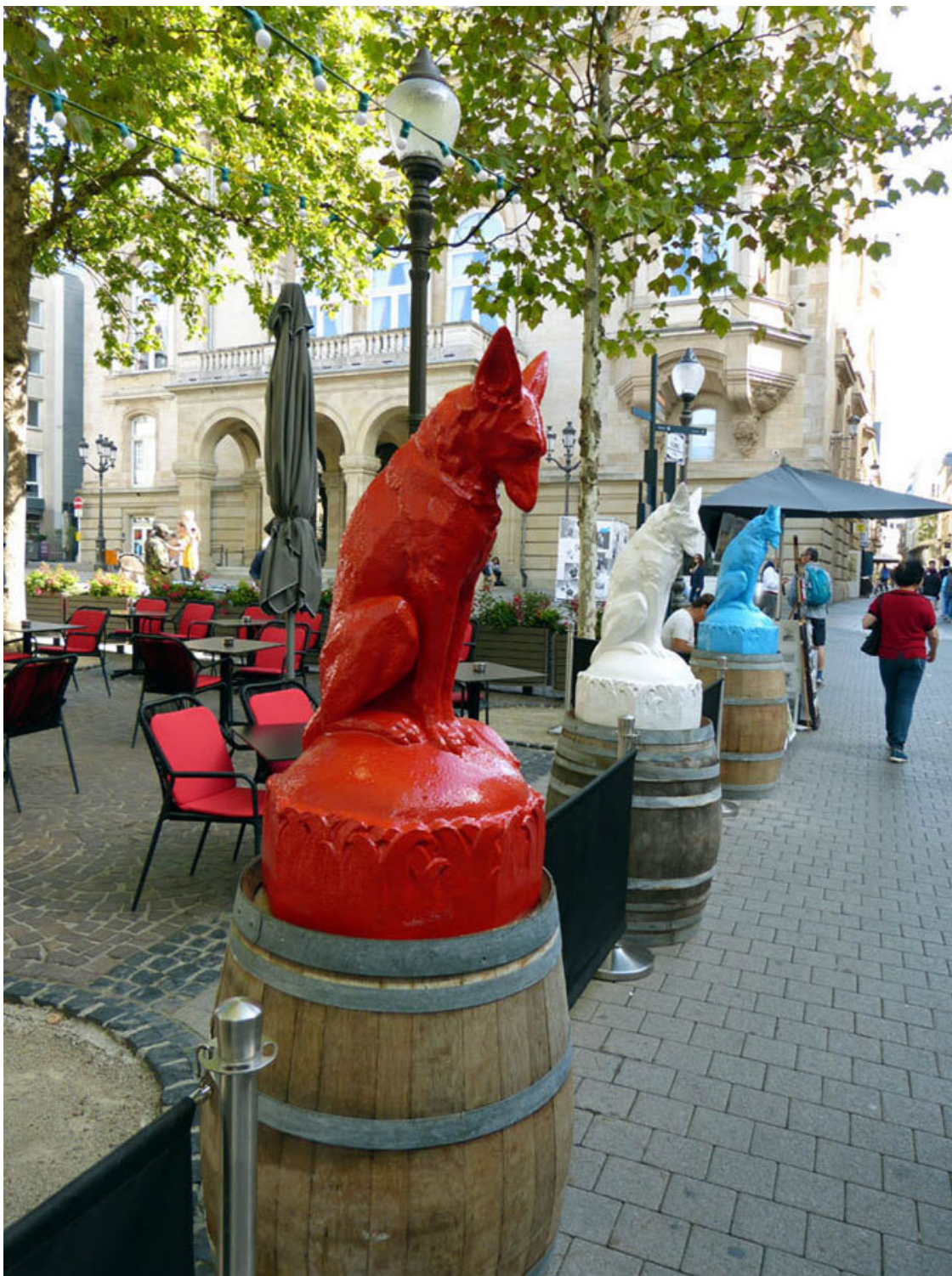
Красный, белый и синий лисы.

Потом заиграл военный оркестр, и сразу появилось ощущение, что мы очутились во Франции. К тому же большинство народа вокруг разговаривало по-французски. От Place d'Armes мы прошли до следующей крупной площади, Place Guillaume II. Местные называют её Knuedler в честь францисканского монастыря, который располагался здесь с XIII по конец XVIII века. Францисканскую робу подпоясывают верёвкой с тремя узлами, символизирующими три монашеских обета. А «узел» по-люксембургски – «de Knued» или в просторечии «Knuedler».