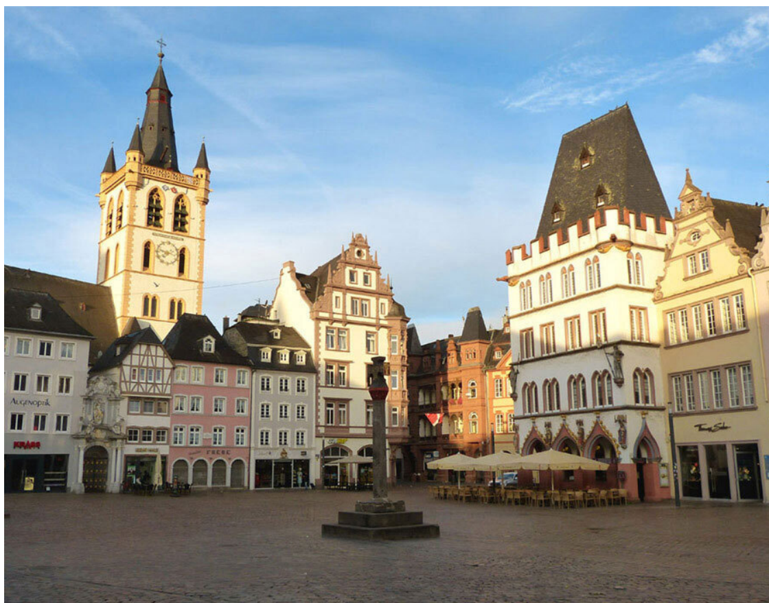
Трир, главная площадь, Hauptmarkt.

Отправились гулять. Первым делом вышли на главную площадь, Hauptmarkt. Красивое местечко с яркими фасадами домов! В центре площади стоит на гранитной древнеримской колонне рыночный крест, самый старый в Германии. Этот каменный монумент воздвиг в 958 году архиепископ Генрих I в знак того, что вся торговля осуществляется под контролем рыночного суда. Чуть в стороне виден барочный фонтан Святого Петра, поставленный на площади в 1594–1595 годах в честь небесного покровителя города. Чаша фонтана являлась распределительным бассейном водопровода – сюда подводилась вода из источника Херренбрюнен.