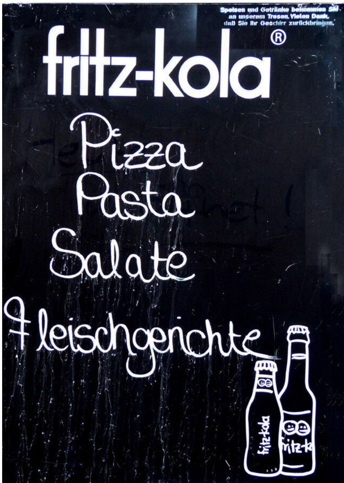
Реклама «Fritz-kola» на улице.

Перед тем, как подниматься в номер, посмотрели, какой же подвал в «Romantik Hotel zur Glocke». Оказалось, что очень красивый и интересный, поэтому решили завтра поужинать там.