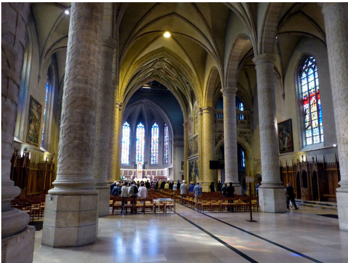
В главном нефе собора.

Полюбовавшись интерьерами собора, мы вышли через северный портал и направились в сторону Rue du Marché-aux-Herbes. На этой улице располагаются здание парламента и дворец великого герцога.