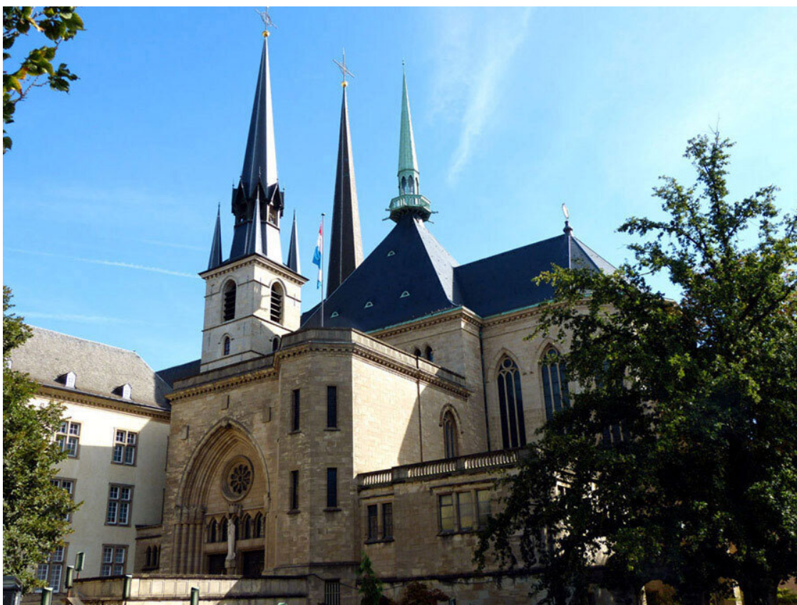
Собор Люксембургской Богоматери.

10 октября 1666 г. городской магистрат признал Богоматерь святой покровительницей города Люксембург. А 20 февраля 1672 года под покровительство Девы Марии отдали всё Великое герцогство. В 1794 году чудотворную статую перенесли в иезуитскую церковь. 31 марта 1844 года этот храм посвятили Богородице, а в 1870 году – сделали собором. Из-за народного паломничества к чудотворной статуе в 1935–1938 годах храм расширили, добавив новый вход на юге.