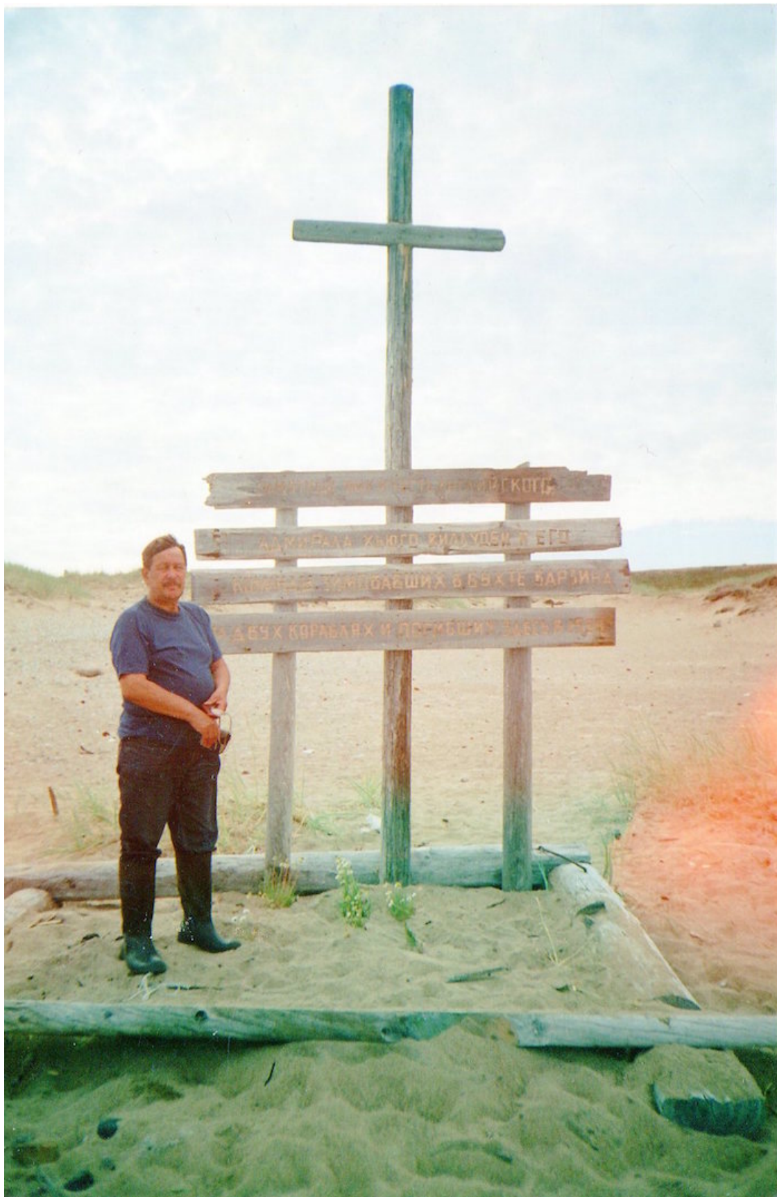
Памятный знак, загадочно погибшей в 1554 году в Варзинском заливе экспедиции.