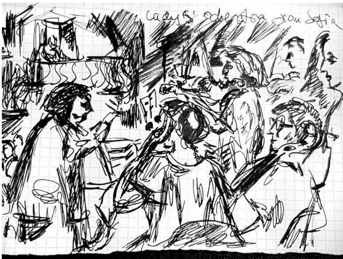
Рисунок И. Бродского «Женский оркестр», Сицилия, июль 1990 года.