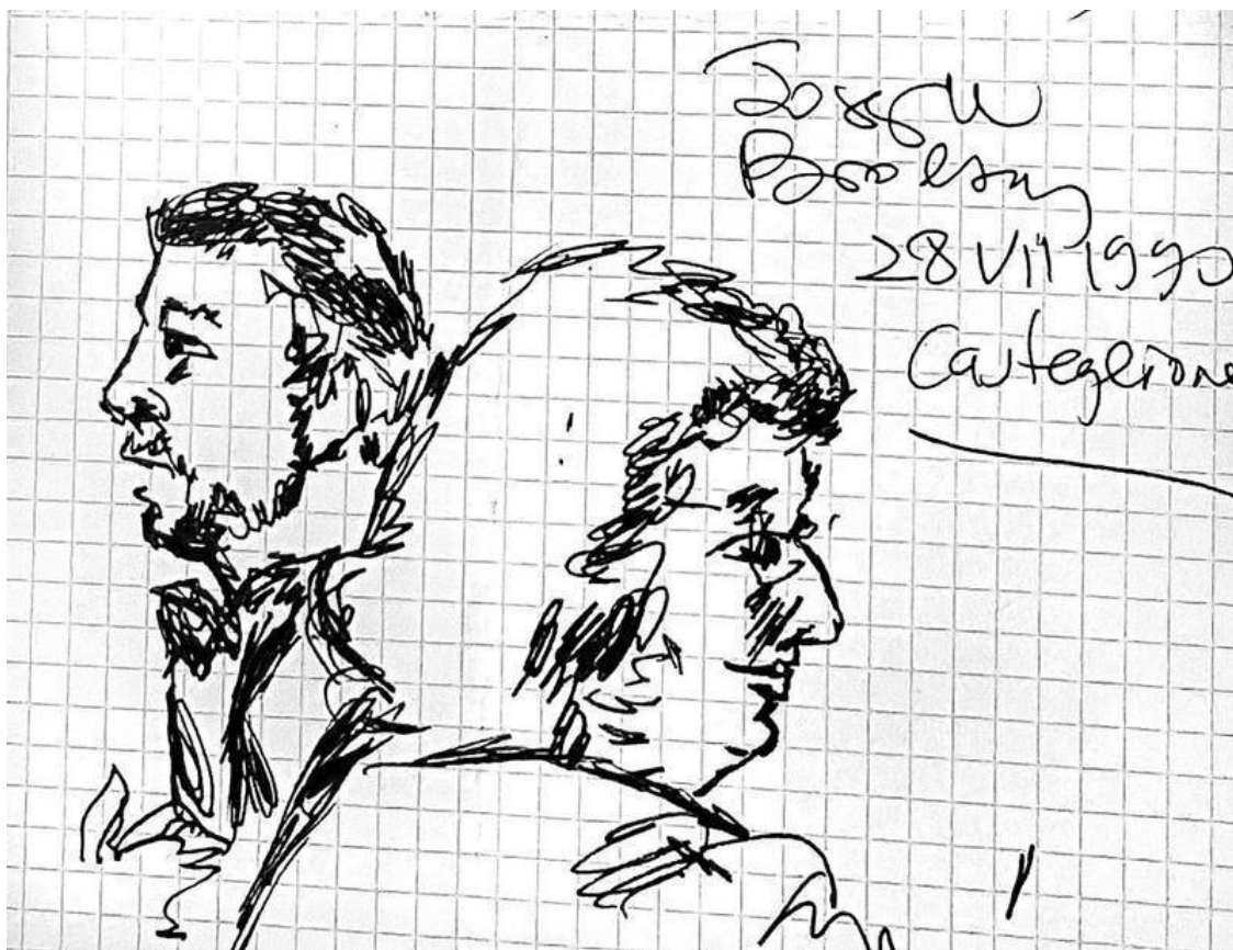
Рисунок Иосифа Бродского двух зрителей из публики на церемонии вручения премии в Кастильоне-ди-Сичилиа 28 июля 1990 года (рис. из архива Эвелины Шап, публикуется с разрешения Фонда И. Бродского).

попросил у Эвелины листочек и нарисовал на нем любимого кота Миссисипи, снабдив рисунок подписью: «JOSEPH BRODSKY, July 1990, TAORMINA». Таким образом, рождение «Магического кота Иосифа Бродского» произошло в городе Таормина на Сицилии 27 июля 1990 года.