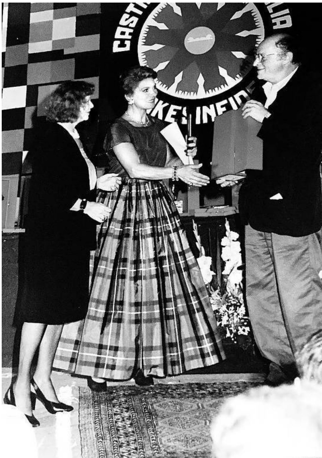
Премия вручена поэту: в кармане И. Бродского виден листочек с его «итальянской речью».