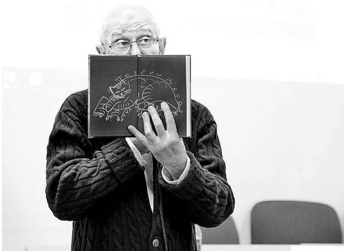
Обложка книги, под которой живет магический кот поэта.