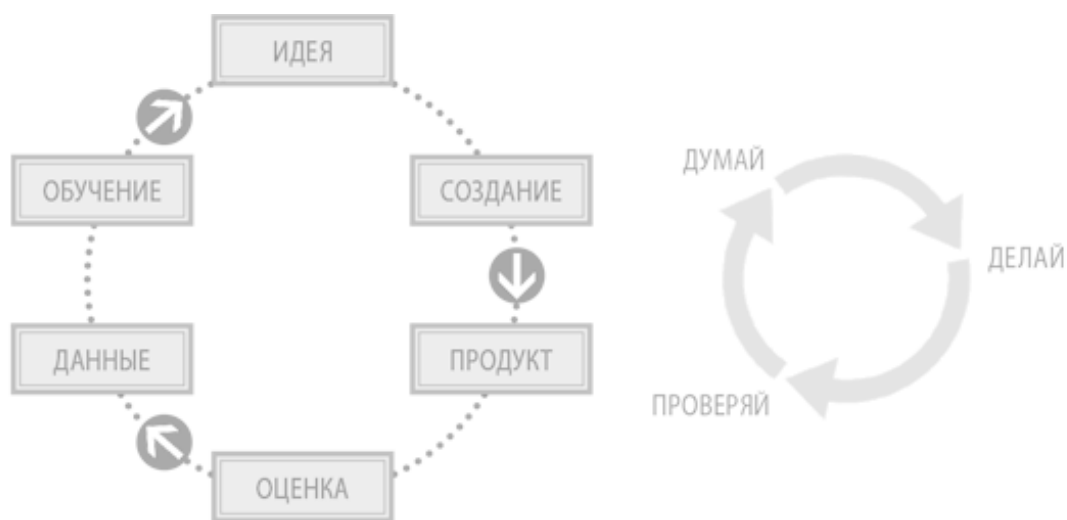
Рис. 1.2. «Создать — оценить — научиться» — цикл обратной связи, описанный Эриком Рисом в книге «Бизнес с нуля» (слева) и «Думай, делай, проверяй» — аналогичная последовательность действий, предложенная Дженис Фрезер (справа)

Развитие потребителей – важнейший элемент этапа «Думай». Он позволяет заниматься изучением потребителей и рассматривать различные варианты продукта на самой дешевой стадии его разработки – до того, как будет написана программа или произведен опытный образец. Развитие потребителей позволяет получить необходимую информацию для выработки наиболее обоснованного исходного предположения, которое вы в дальнейшем сможете проверить.