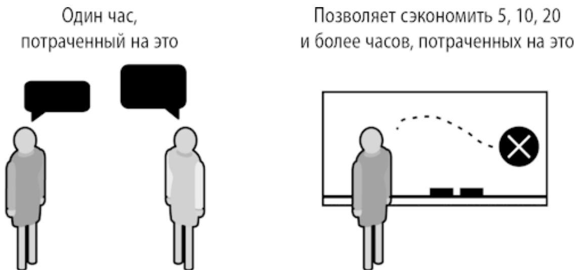
Рис. 1.1. Беседы с потребителями экономят время и деньги

Развитие потребителей начинается со сдвига в сознании. Вместо того чтобы считать свои догадки и предположения безусловно верными и не мешкая переходить к развитию продукта, вы будете изо всех сил стараться найти слабые места и ошибки в своих подходах, проверять обоснованность своих представлений.