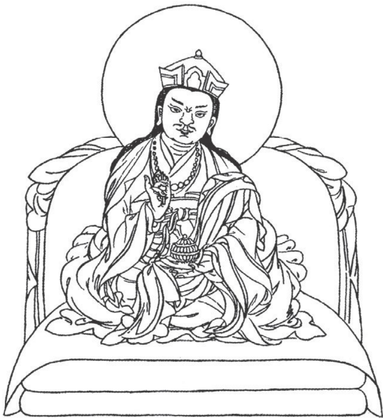
8. Чокгьюр Лингпа – открыватель учений-кладов