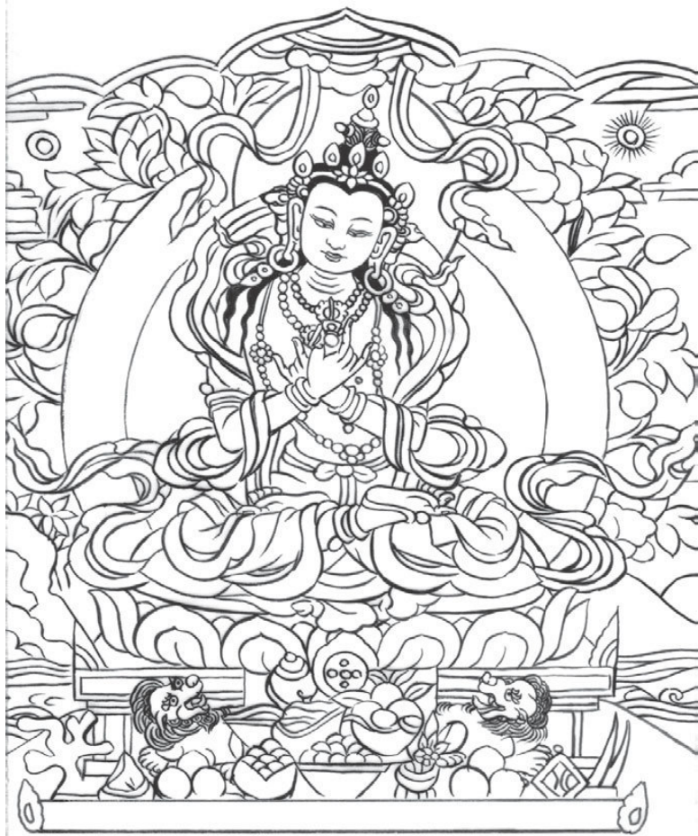
6. Ваджрадхара – будда дхармакая