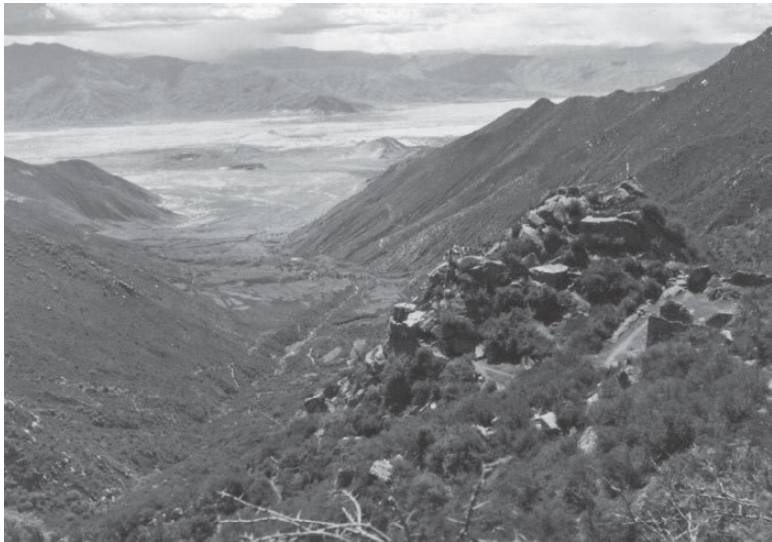
4. Чимпу – вид из пещеры над Самье