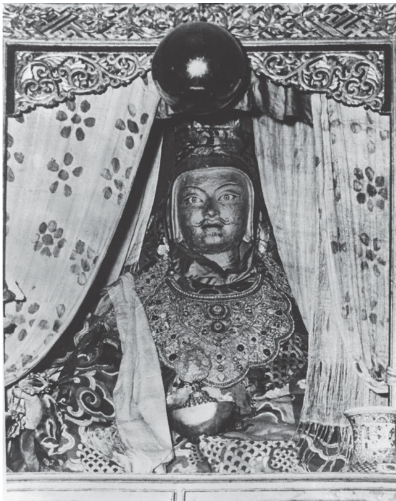
5. Падмасамбхава – Лотосорождённый Гуру