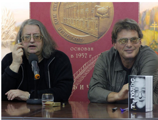
«Александр Градский. The Голос».

Здесь собраны разговоры с музыкантами, которые я записывал с 2012 года. В студии канала «Москва 24» (проект «Правда-24»), студии радио Mediametrics (проект «Мимо-Нот») и в рамках авторских проектов «Семейный альбом» («Россия 1») и «Важная персона» («Москва 24»).