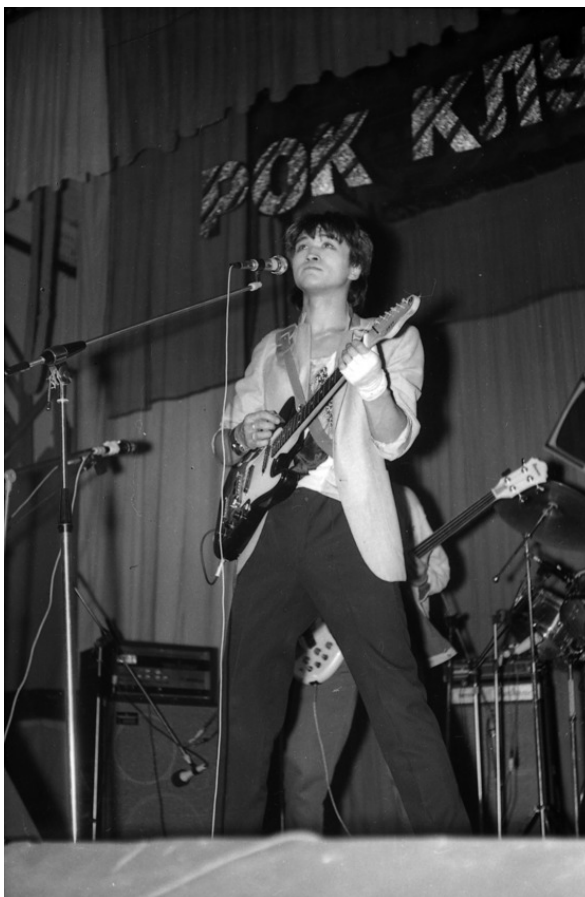
3-й фестиваль рок-клуба.

– Да нет, зачем мне об этом смотреть? Я же жил в то время.