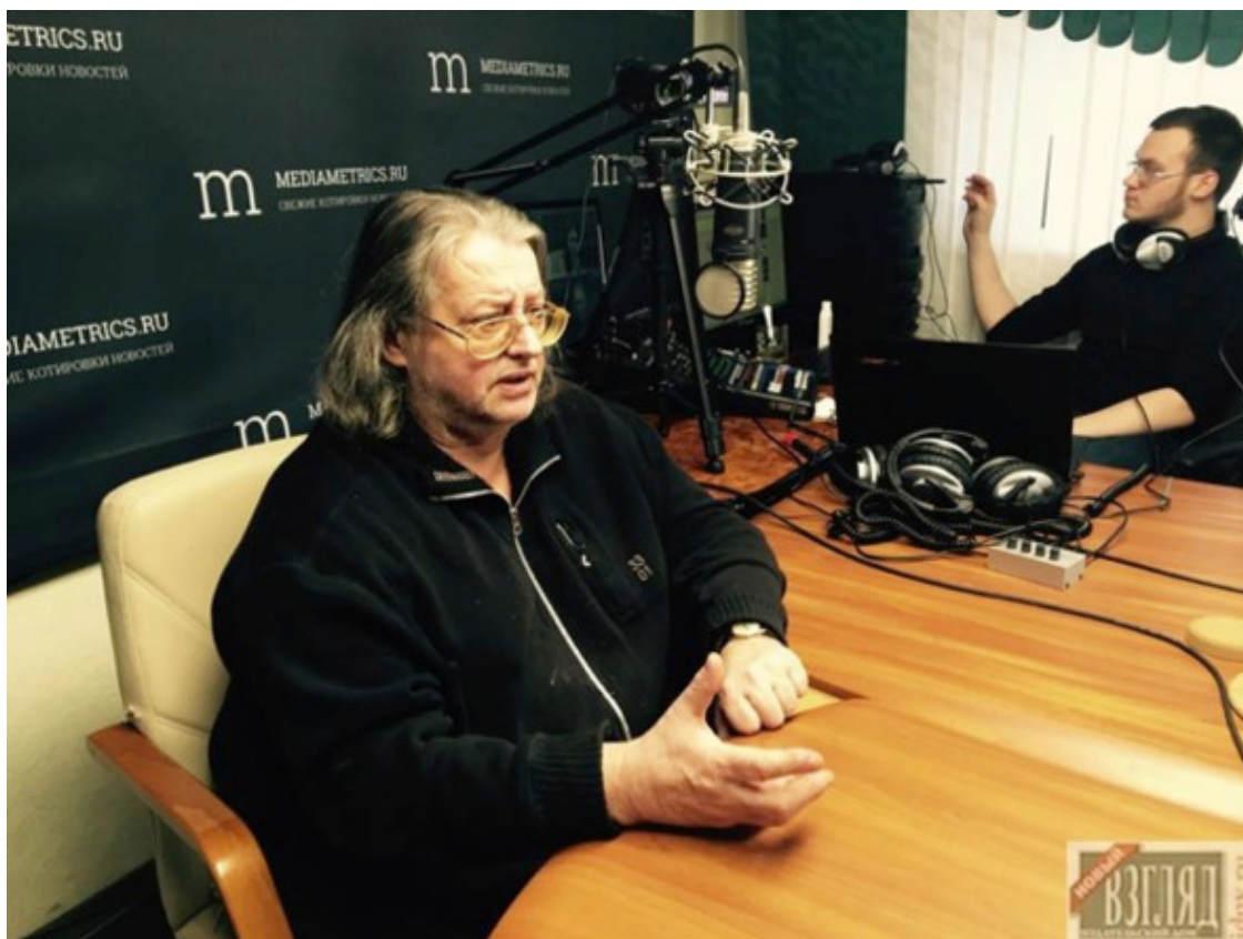
Градский. В студии радио Mediametrics (проект «МимоНот»).

Что, впрочем, никак не влияет на статус самых гениальных музыкантов в истории рок-движения. Но этот тезис и Газманов, к слову, не пытается оспаривать.