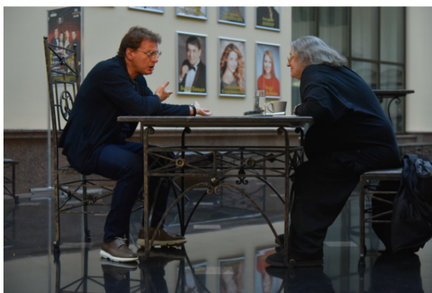
«Я, допустим, уже упомянутого Александра Борисовича Градского спрашивал...», 2019.

– Александр Борисович, это совершенно отдельная субстанция, он сам по себе. Мы у него работали, в этом его зале. «Градский холл», да, мы пришли, он говорит: я вам всё настроил, там всё под меня.