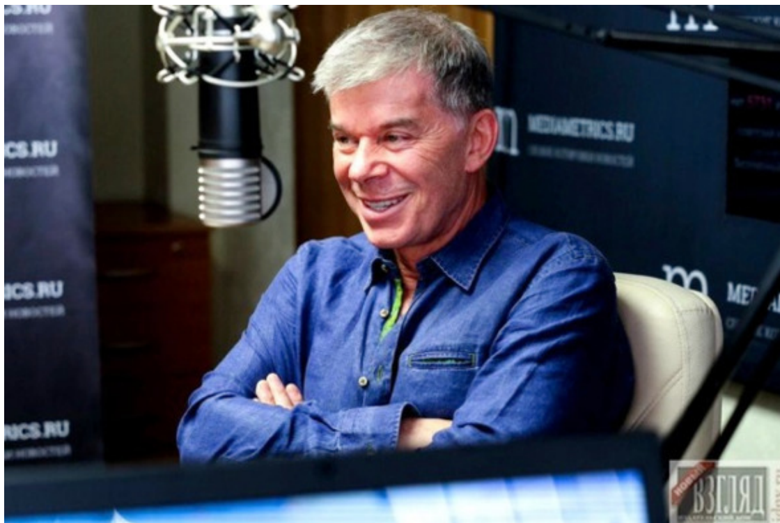
Газманов. В студии радио Mediametrics (проект «МимоНот»).

лась отношением народного артиста к «делу Сердюкова » и нынешней экономической ситуации.