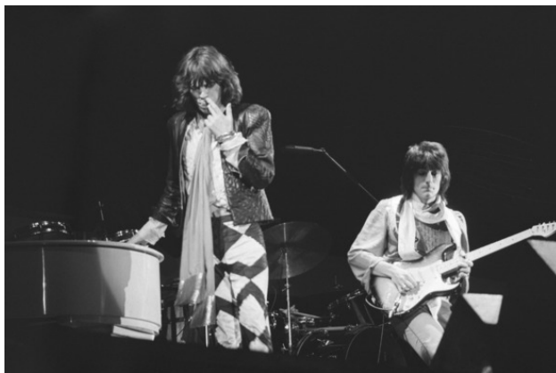
Rolling Stones, 1976.

«80% того, что спето Led Zeppelin, слушать невозможно, потому что это сыграно и спето плохо. В то время это все воспринималось, все нравилось. Rolling Stones гитару не настроили за всю жизнь ни разу, а Джagger ни в одну ноту не попал ни разу, ну что поделаешь. Кит Ричардс как тогда не умел играть, так и сейчас не умеет. Но в этом есть определенный драйв, кайф какой-то. Многие проецируют свою молодость на эти группы, а ведь они были очень слабыми».