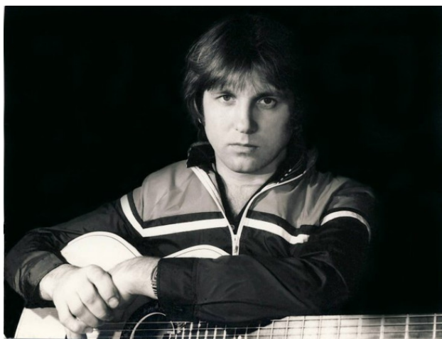
Фото из личного архива Юрия Лозы.

— Зачем мне это нужно? Единственное, что я всегда показываю жене, она всё-таки закончила литературный институт, и один из лучших поэтов у нас сейчас в России. Она прекрасно разбирается. Она, в первую очередь, это человек, который может сказать «нравится – не нравится».