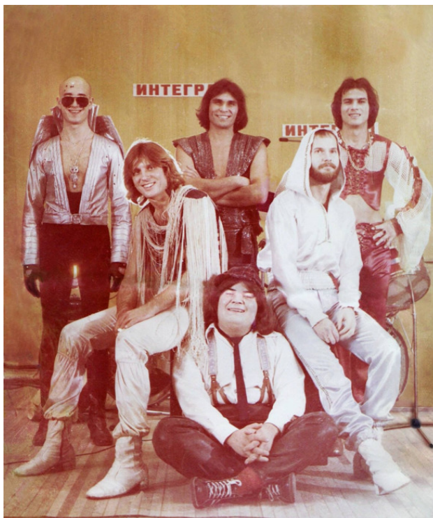
Фото из личного архива Юрия Лозы.

Вот это протестное начало и вынесло на эстраду очень многих. Когда мне говорят: как ты можешь про великих такое говорить? Я говорю, возьмите Rolling Stones и представьте, что этот альбом вышел не тогда, когда он прогремел, а вышел на 20, 30, 40 лет позже. Кто-нибудь заметил бы Rolling Stones? Вот тех Rolling Stones? Не заметили бы, они бы сидели где-нибудь в клубе, как и должны были по качеству своей работы. Но тогда их вынесла именно эта протестная волна.