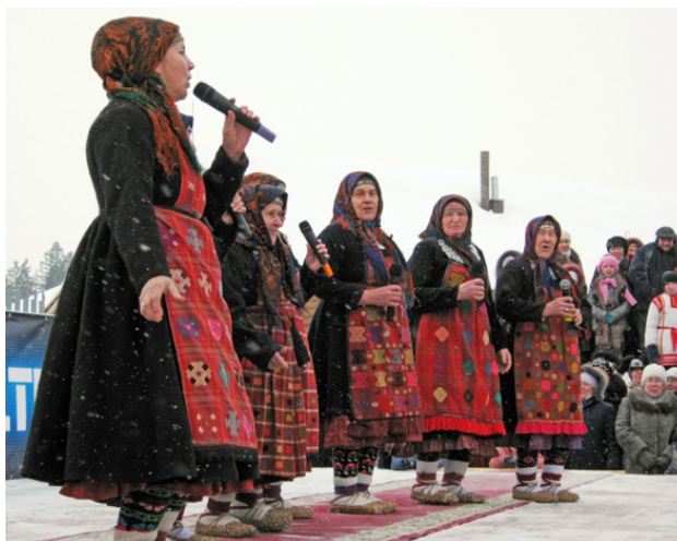
«Бурановские бабушки» одни из самых больших вражин.

– «Бурановские бабушки» одни из самых больших вражин. Объясняю, почему. Уже много лет пытаюсь провести одну мысль. Ребята, что мы хотим получить? Если взять как сверхзадачу пропаганду российской культуры вообще как таковой, тогда все наши, кто туда едут, все враги. Потому что они работают на британскую культуру, а не на нашу.