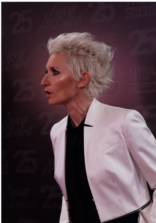
Диана Арбенина.