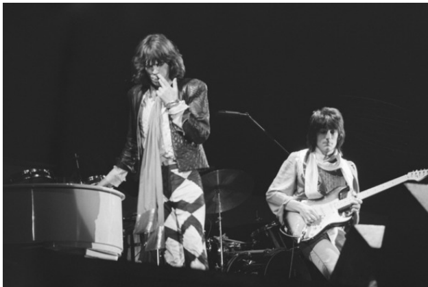
Rolling Stones, 1976.

Ну, ясно какую реакцию вызвало провокационное заявление: в блогосфере Лозу смешали с пищей воробьев (©).