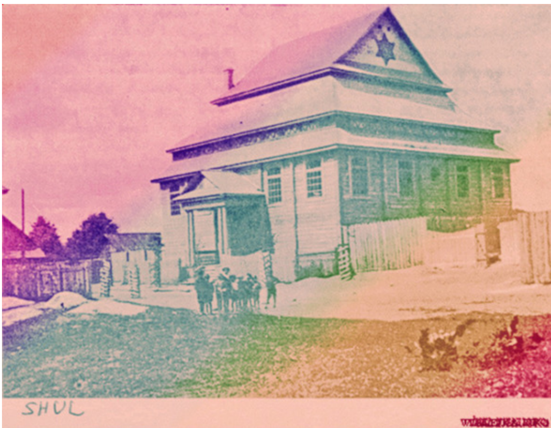
Синагога в Вилейке.

Книга имеет образовательный и культурный характер.