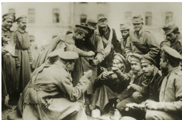
Братание на фронте Первой мировой.

Наряду с Г. К. Жуковым, В. И. Чуйковым, И. С. Коневым, многими другими известными военачальниками, М. П. Кирпонос был, как тогда говорили, выходцем из простого народа.